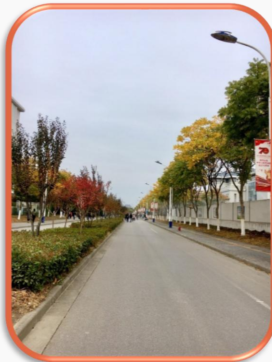
東南大學-九龍湖校區