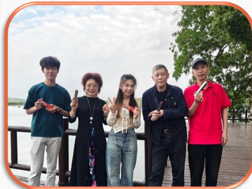
與當地居民交流合照-南京