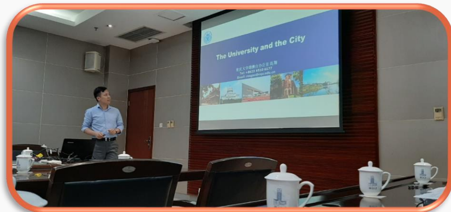
為交換生進行學校簡介-重慶大學