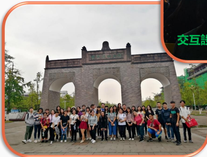
開學週-交換生認識校園四川大學