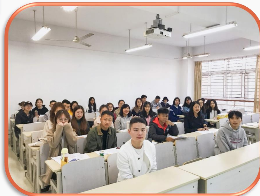
與班上同學合照-南京工業大學