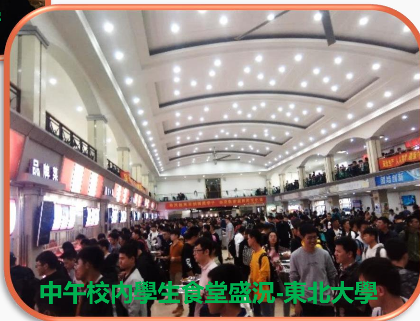
中午校內學生食堂盛況-東北大學