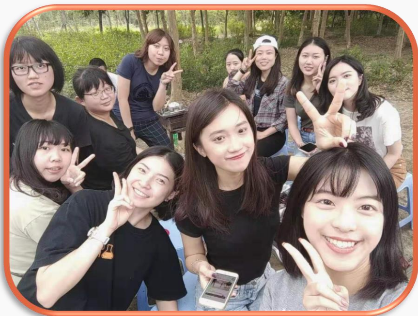
參加當地同學舉辦的燒烤活動-江南大學