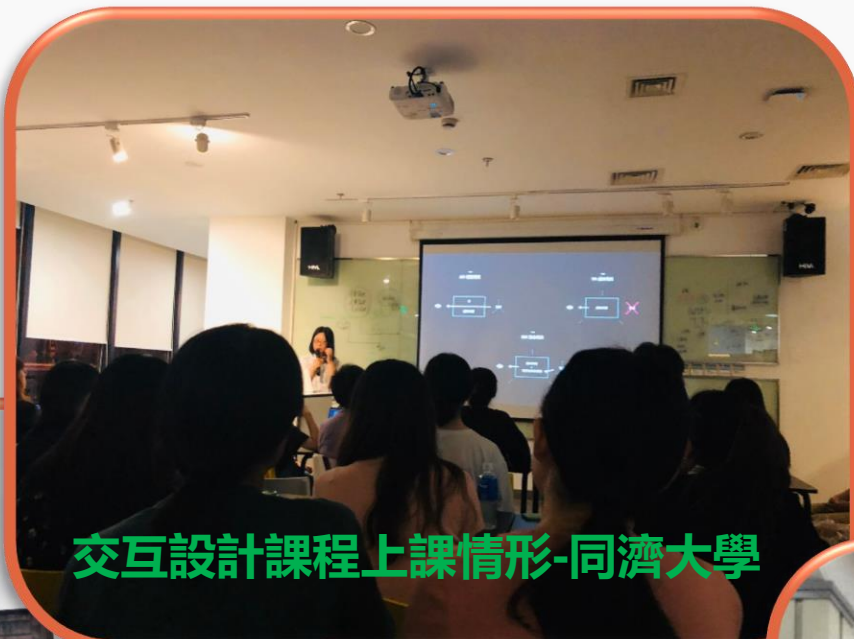
交互設計課程上課情形-同濟大學