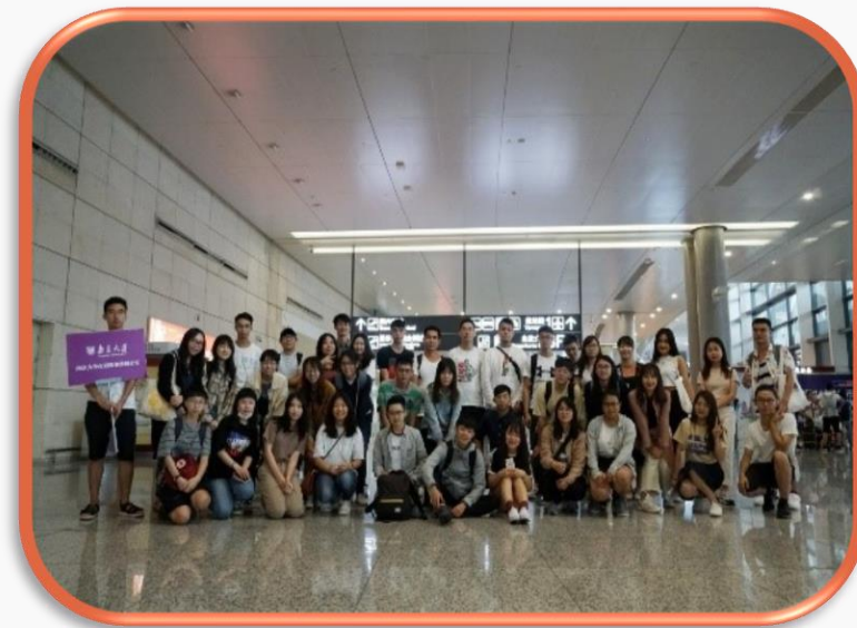
學伴接機-南京大學