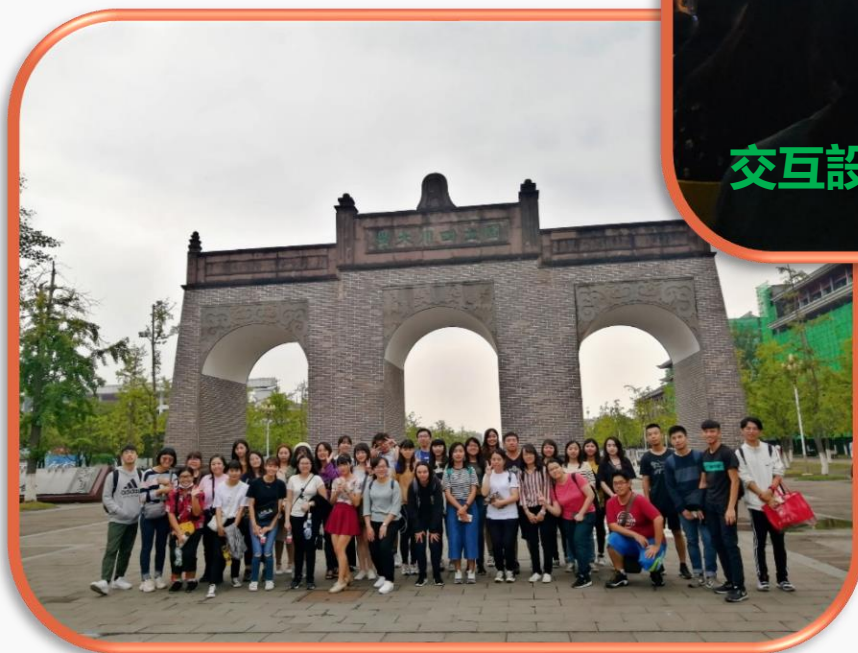
開學週-交換生認識校園四川大學