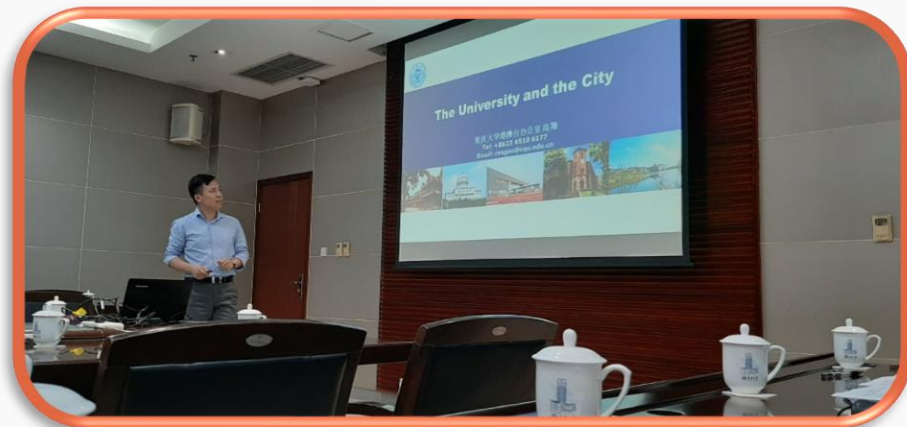
為交換生進行學校簡介-重慶大學