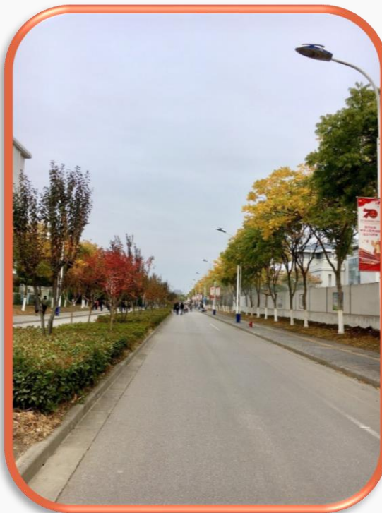
東南大學-九龍湖校區