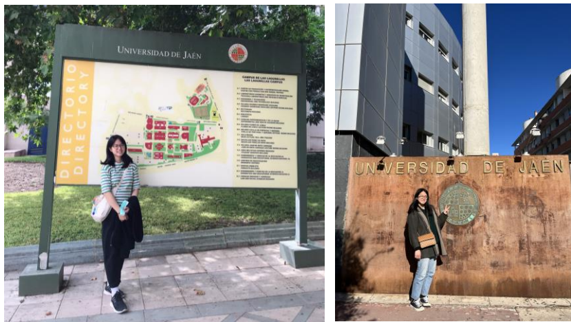
哈恩大學校園與師長