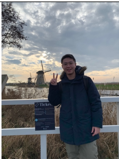
荷蘭-鹿特丹：小孩堤防