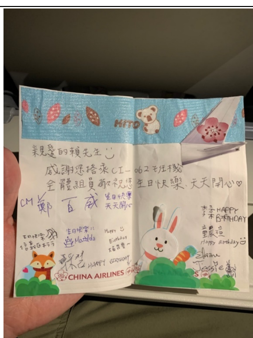
華航機組員特別寫給我的生日卡片