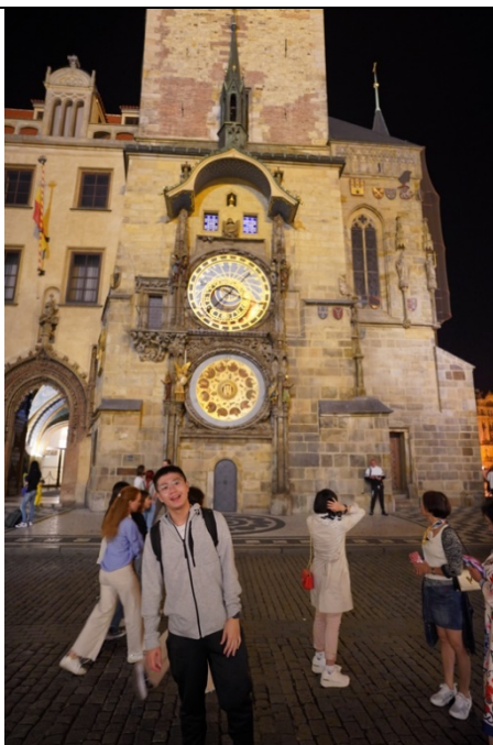
捷克-布拉格：天文鐘