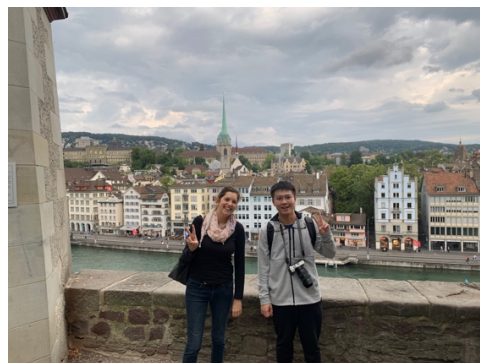
瑞士-蘇黎世：林登霍夫山