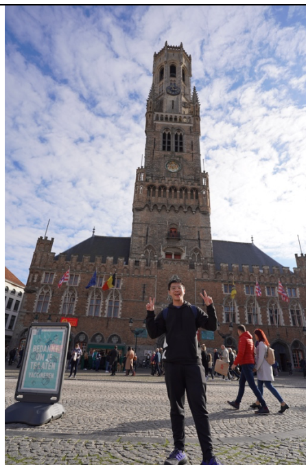
比利時-布魯日：布魯日鐘樓