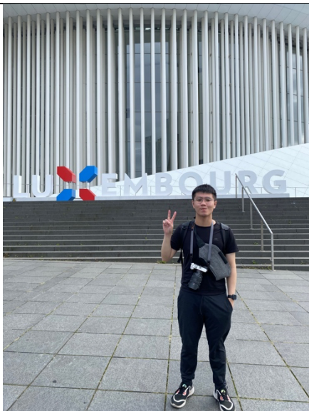
盧森堡：盧森堡音樂廳