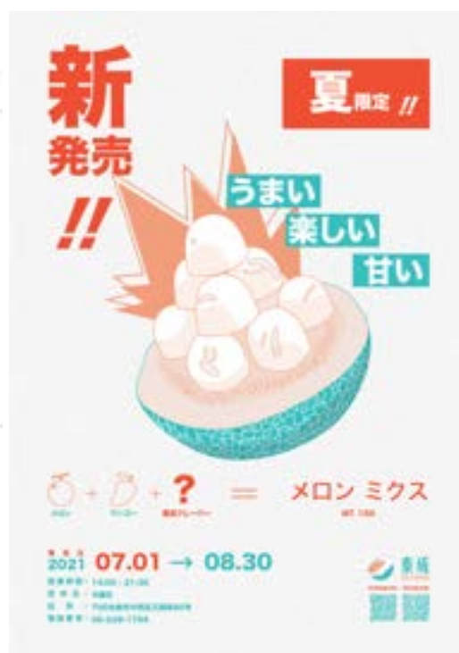
Logo & Poster