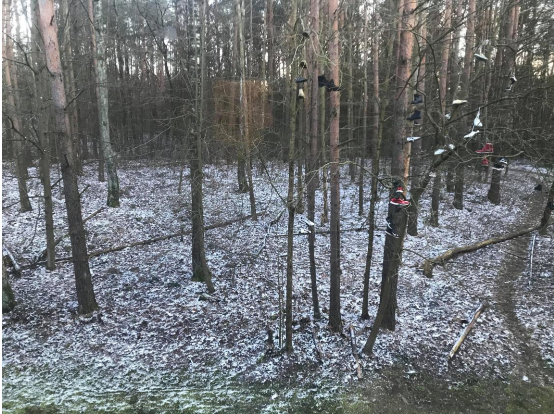
每天睡醒窗外的景象