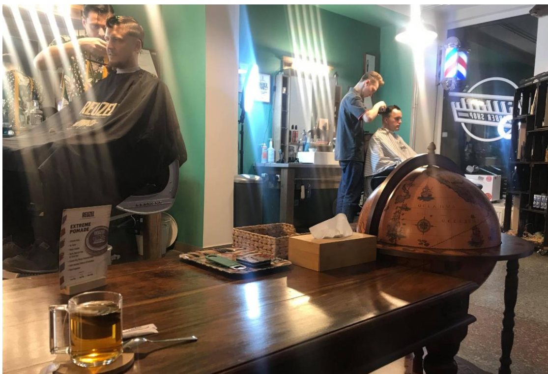
最近油頭文化盛行，到歐洲一定要去他們的 Barber shop