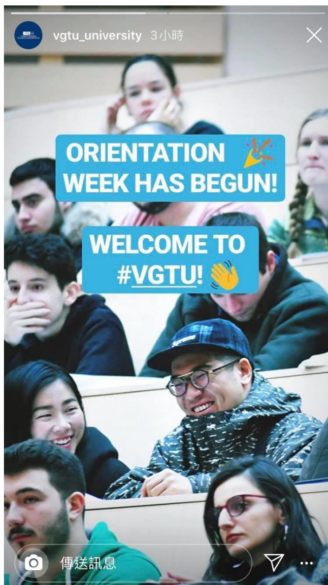
入學第一天，笑開懷。