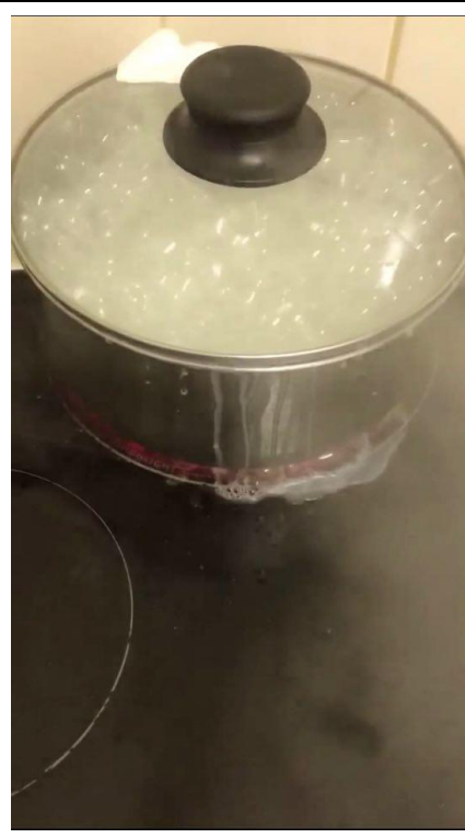
差點爆掉的白米飯

不需要怕一個人出國，也不要害怕一個人去一個你完全不認識真的地方，過程雖然艱難，但是非常難忘的。你看到的世界是與大部分人不同的，我很榮幸可以餐與這次的交換計劃，是我人生最重要的歷程之一。