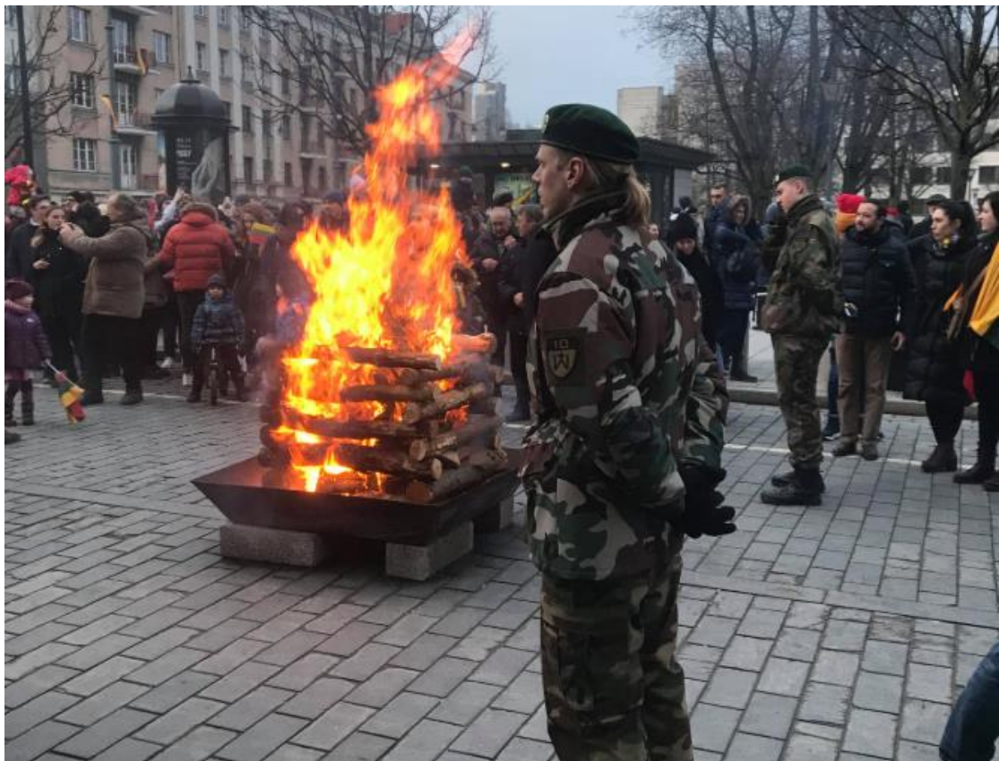
這一天是立陶宛的獨立紀念日