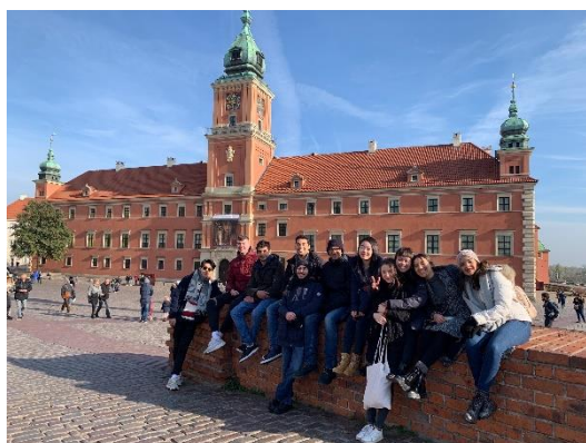
全體交換生出遊合影