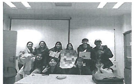
(第一學期的西文正規班結束與老師拍照)