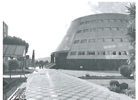
(哈恩大學最為象徵性之建築物,別名:飛碟、布丁)

哈恩大學是一所西班牙公立大學並位於南部安達魯西亞自治區哈恩市,共有五個學院(社會和法律科學,人文和教育科學,健康科學,實驗科學與社會工作)和一個附屬中心並提供超過 40 個學位。根據 2019 泰晤士高等教育世界大學的排名,哈恩大學位於世界上最好的大學的 801-1000 區間,並且排名西班牙大學的 15 名。