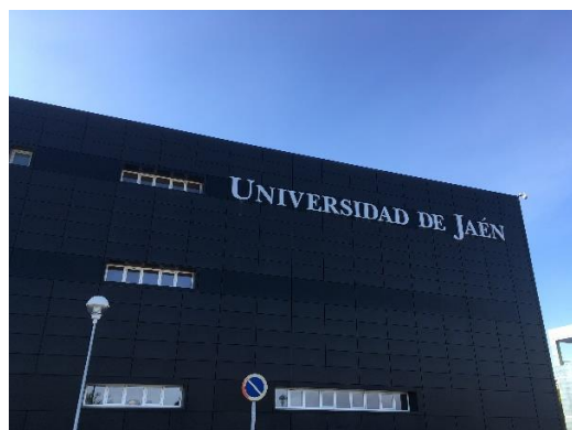
(哈恩大學其一建築)

西方的建築歷史脫離不了關係，因此開啟了我對西方古建築的大門，期待有天能夠實際前往窺探像是家戶喻曉的高第所設計打造建築，於是選擇了西班牙哈恩大學。透過申請交換學生，利用在校的求學過程中，體驗國外的教育方式，增加多數人都沒有的經歷，開拓自己的國際視野，還有不管是語言能力、社交能力以及獨立自主的能力都能透過交換來做磨練，提升自己全方位的能力。