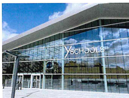
圖一 特魯瓦高等商院校園外觀

由於想以較為輕鬆的方式體驗國外的校園及日常生活，因此我選擇以交換生的身分至法國進行為期一學年的交換，並藉由此次的交換，選修一些同樣在商管領域我卻從未接觸過的課程，增加更多方面的知識。此外，也想藉由此次的交換，加強自己的語言能力及深入了解歐洲文化。