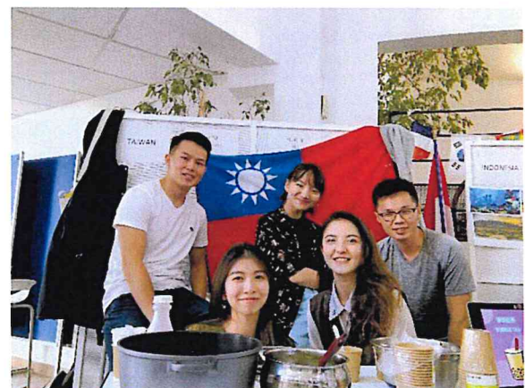
圖五 Universities Forum 活動