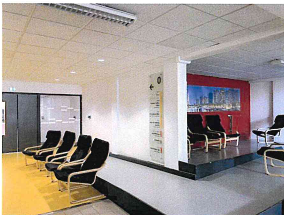
圖四 校內公共空間