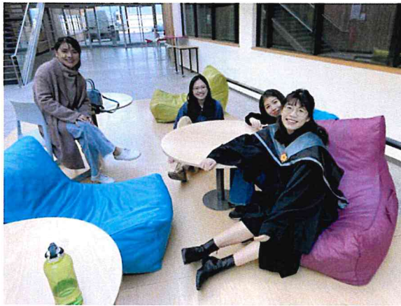
圖二 校內公共空間