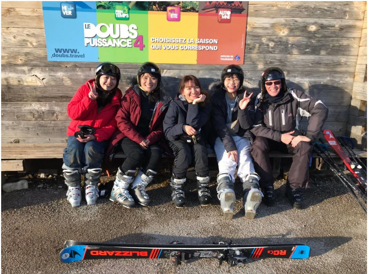
房東帶台灣朋友們趁著雪融化之前去滑雪場體驗滑雪