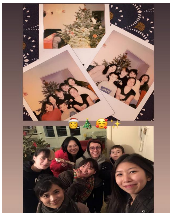
在法國度過的 2019 聖誕夜