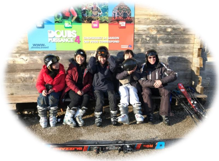
和法文老師的合影