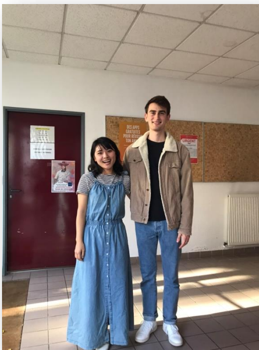
學校舉辦文化節時 認識的丹麥朋友