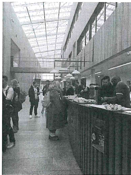
圖(二) 新生說明會學校準備麵包及飲料招待各國交換生