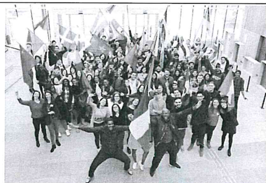
圖(三) 全體交換生與各國國旗合影