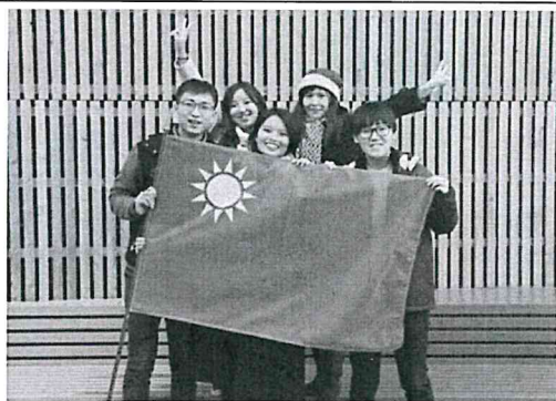
圖(四) 與同一批的台灣交換生合影