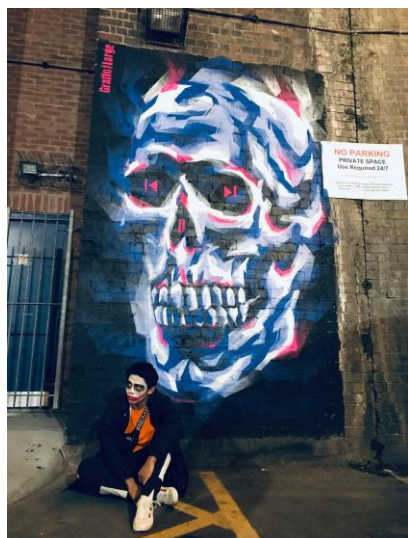
人生中第一次化妝過萬聖節

而在課業之餘，我也在這十個月去了英國許多知名的景點，包含在歷史課本上看到的巨石陣、夢寐以求的倫敦眼以及倫敦塔橋、愛丁堡的美景…等，我認為可以到陌生的地方走走真的是非常難得的經驗。而在這趟十個月的旅程中，我也遇到了一些突發狀況，像是手機被偷，或是班機在登機前一小時因為事故被取消，但身處在國外，凡事都得靠自己，而我也相信經過這些棘手的突發意外，都能使我成長並且下次遇到時能更得心應手的解決，培養我靈機應變的能力。