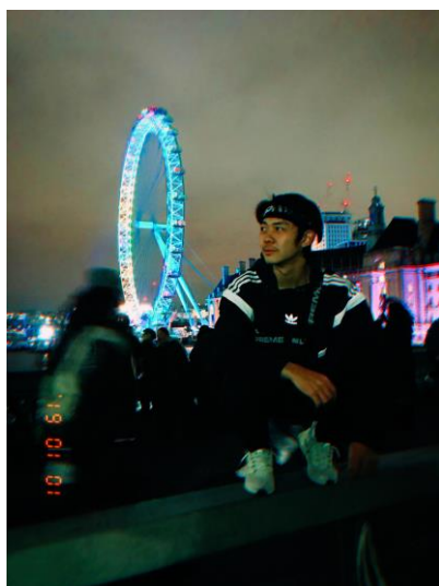
倫敦眼人擠人看煙火跨年