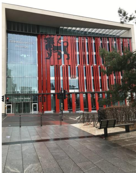
位於市中心的 Curzon Building

全年無休的圖書館供學生進修及查詢課程相關資料，還有一對一的論文輔導以及各種課業上相關的諮詢服務可供學生報名預約。除了課業上相關的課程，學校也不定期舉辦許多課外活動，讓學生在課業之餘，調解身心並且認識更多朋友。