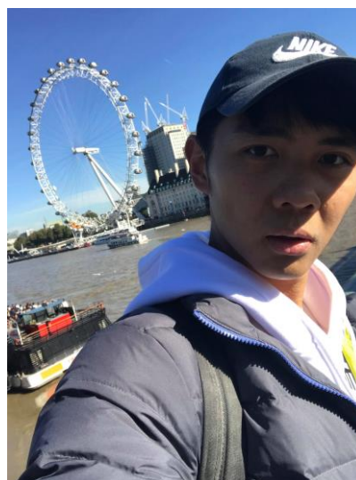
第一次到倫敦興奮地與倫敦眼自拍