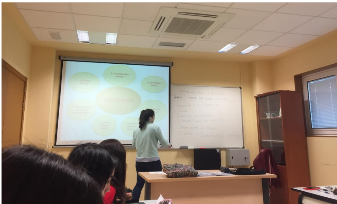
上課方式與臺灣差不多使用白板跟投影片，但很著重開口說西文互動

大部分的課程每天都會有回家作業，從寫作、文法、報告、到錄影片練習口說都有，目的就在於多加練習，要開口講跟多使用新文法，西文才能夠進步。