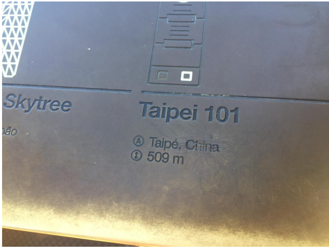
在國外的一些景點旅行，難免會看到中國打壓臺灣的痕跡