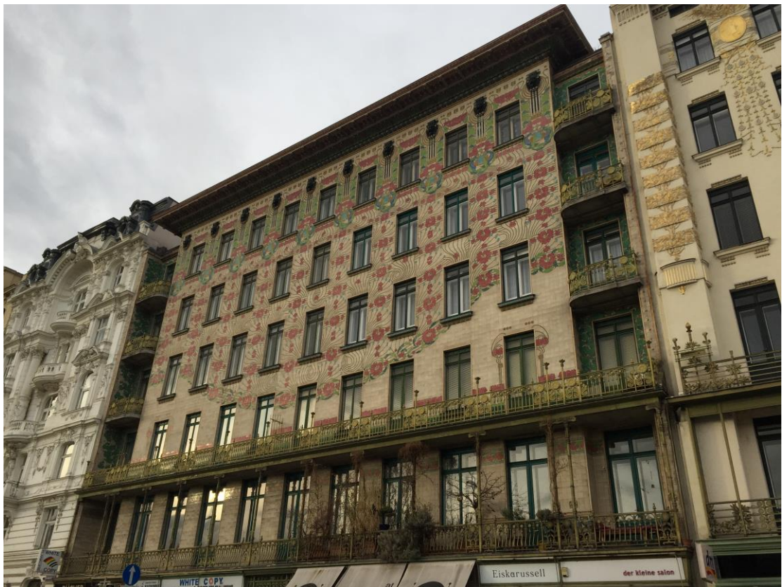
維也納分離派，瓦格納所做的公寓，現況保存非常良好