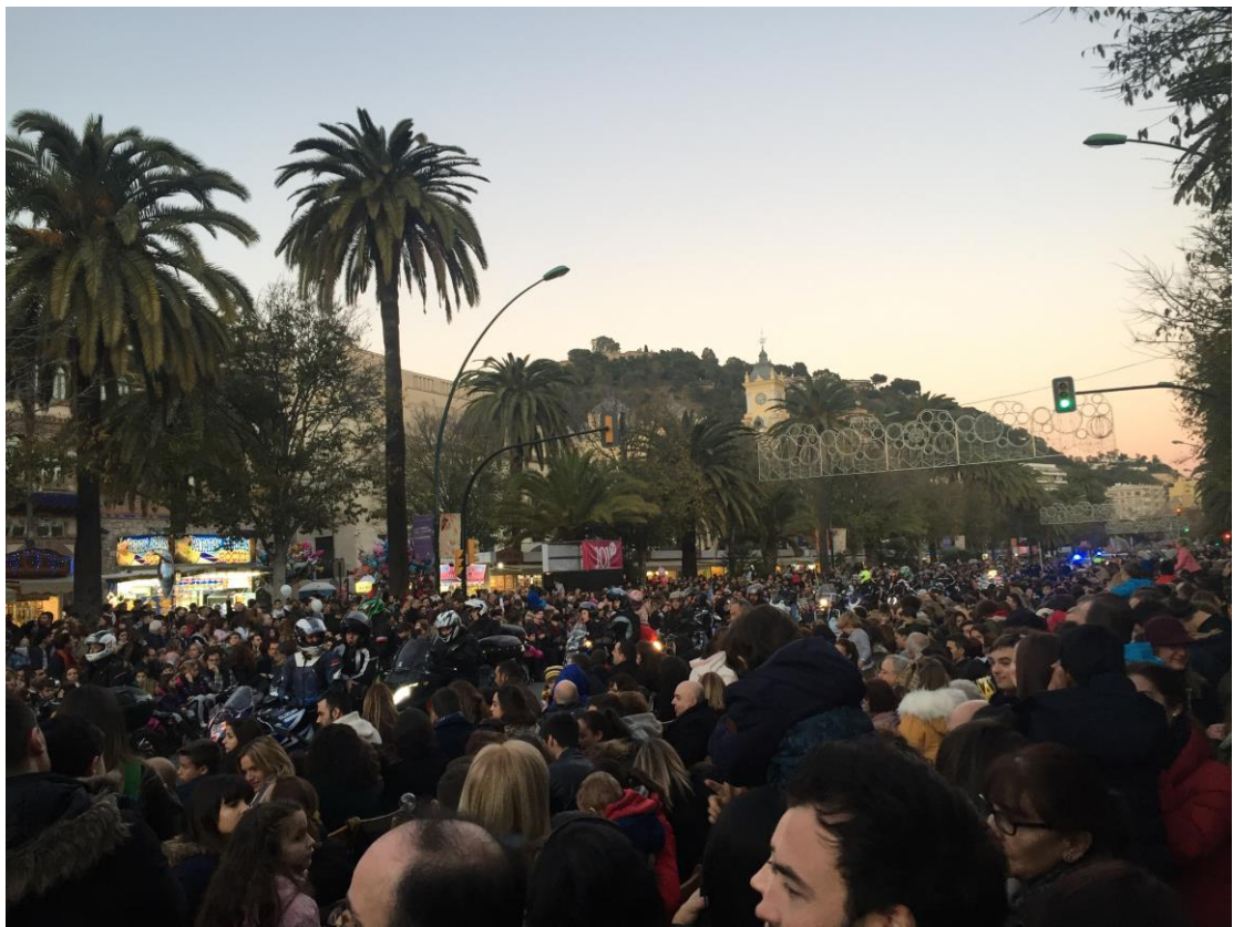
馬拉加的三王節遊行