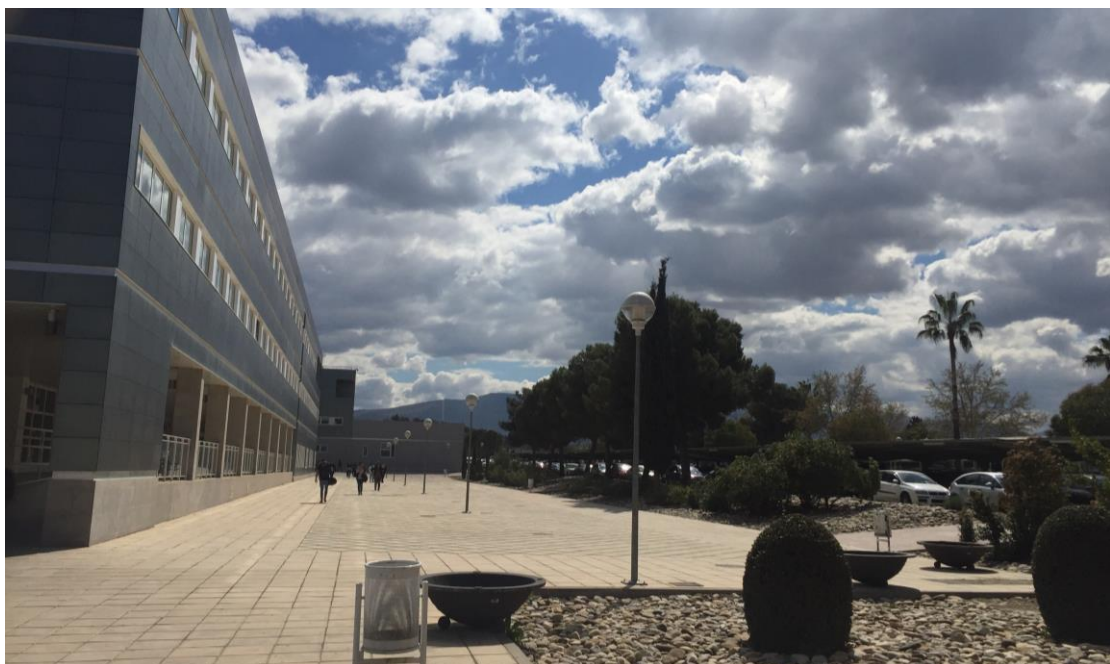
語言中心位於 C6，處於學校最遠的角落