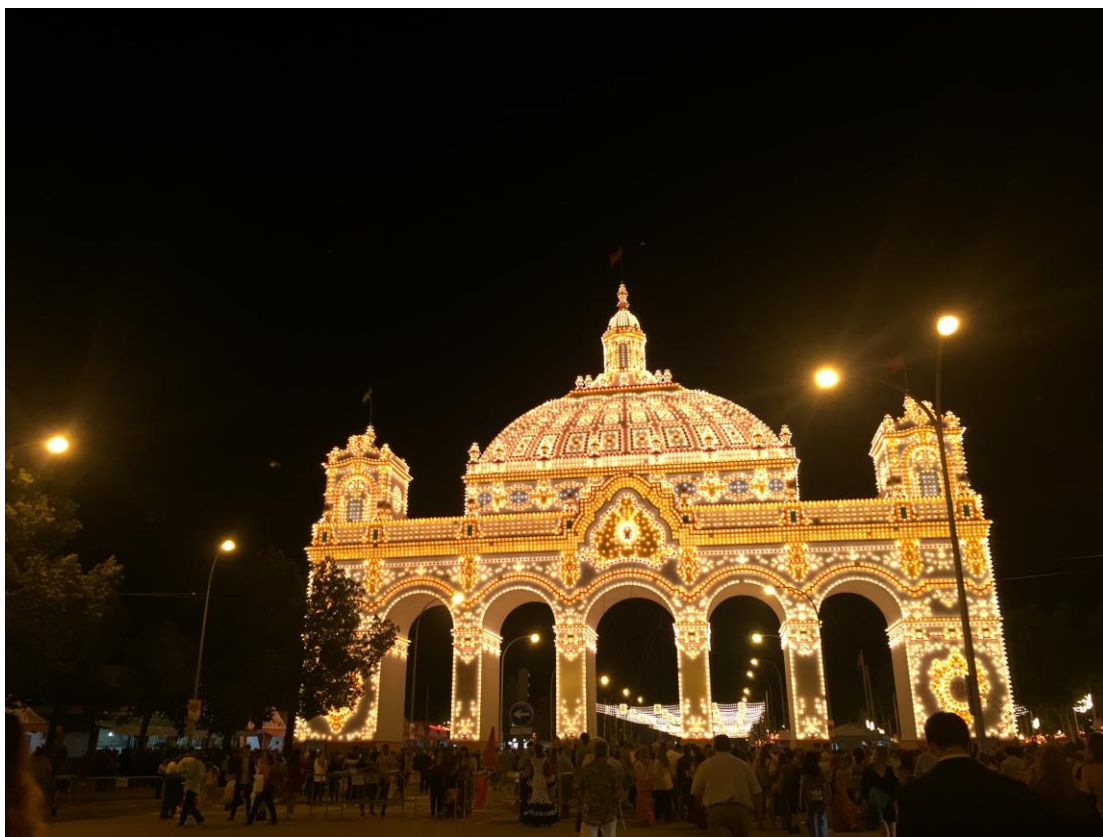
塞維亞的四月節慶，有超大型的臨時遊樂設施