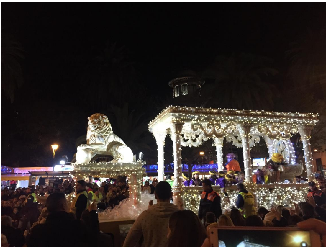
上面的人會丟糖果下來給小朋友檢