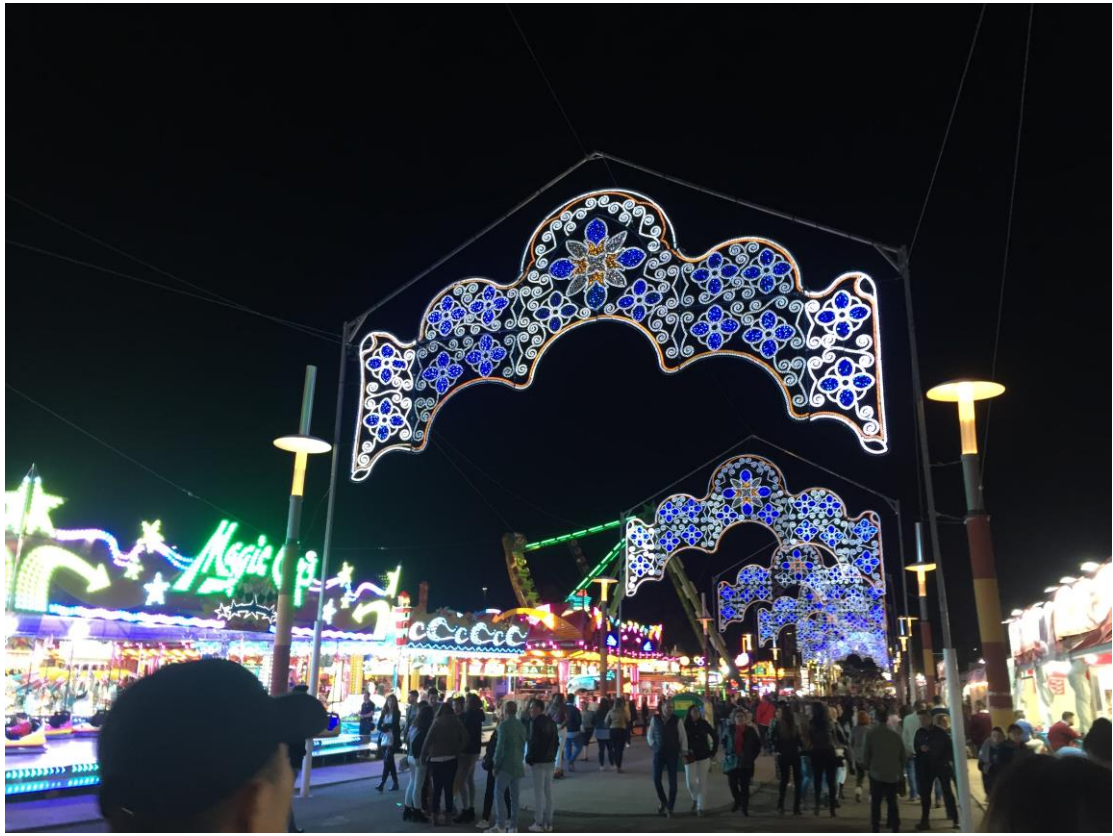
哈恩的聖盧卡斯節，在這一週內會有很多臨時遊樂設施