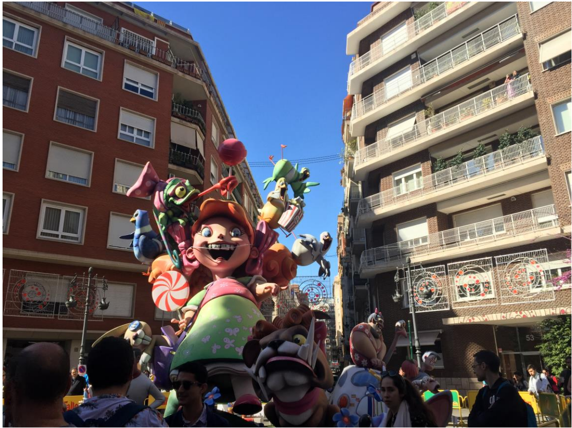
瓦倫西亞火節的大型木雕