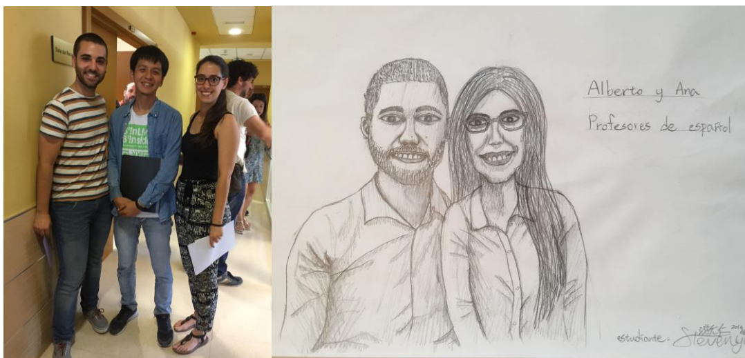
西文老師的年紀多數都在 30 歲以下