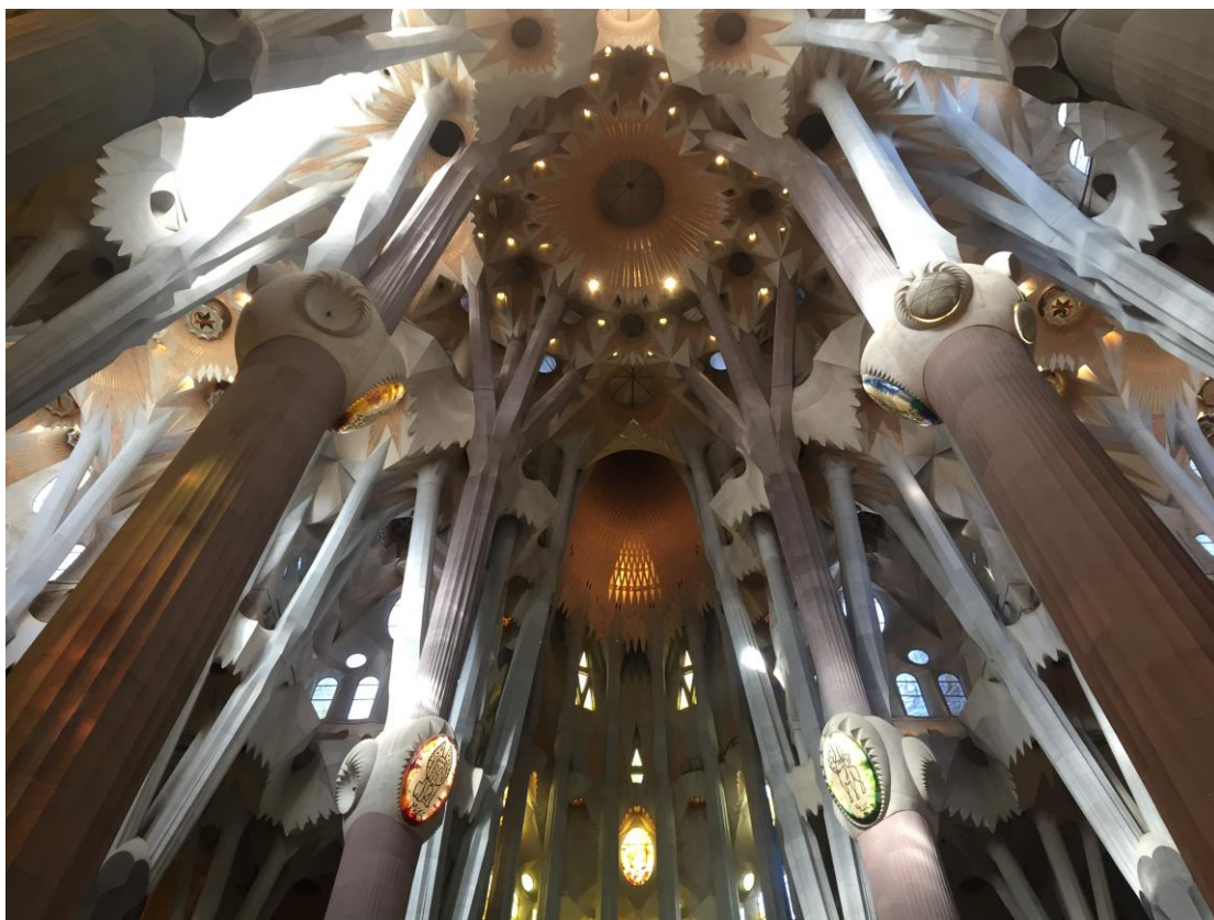
巴塞隆納聖家堂大廳裡頭的柱林，感受到高第滿滿的設計熱忱