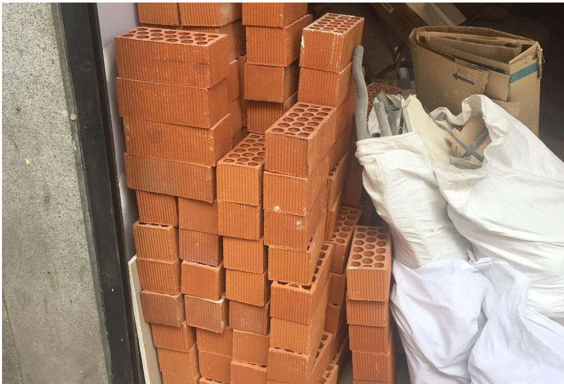
西班牙人建築的牆面都用空心磚填充

過去高中所學的歐洲歷史，著重於英德法，鮮少提及西班牙，我在西班牙旅行時，參觀了許多的城堡以及宮殿，看著當時羅馬人、哥德人、摩爾人所留下來的古代遺跡，是如何經過歷史的歷練，保留到今日。在卡斯提爾及亞拉岡王國合併後，又如何演進至現今的西班牙，成為航海霸權到沒落，當中加泰隆尼亞地區與西班牙皇室的矛盾，是如何漸漸形成獨立運動，最後則是近代的佛朗哥政權，大大影響了西班牙保留王室傳統及二戰的走勢。