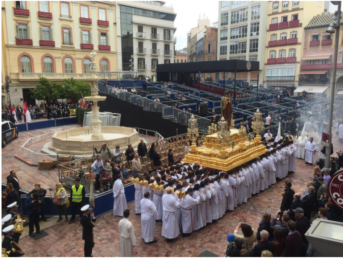
復活的耶穌雕像被一百多人扛著往前移動