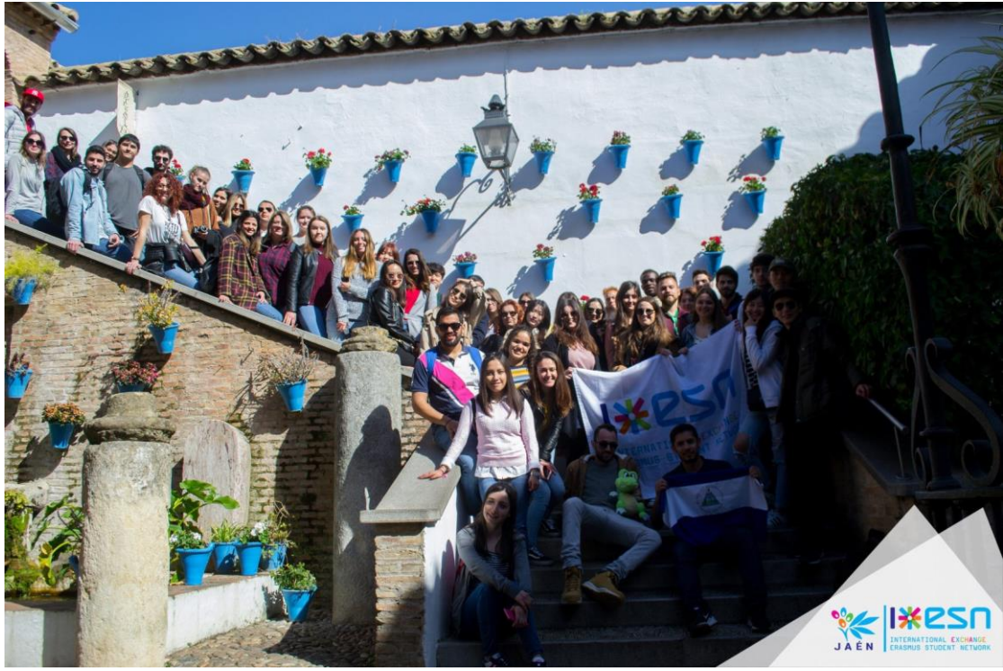
參加 ESN 哥多華的一日旅遊