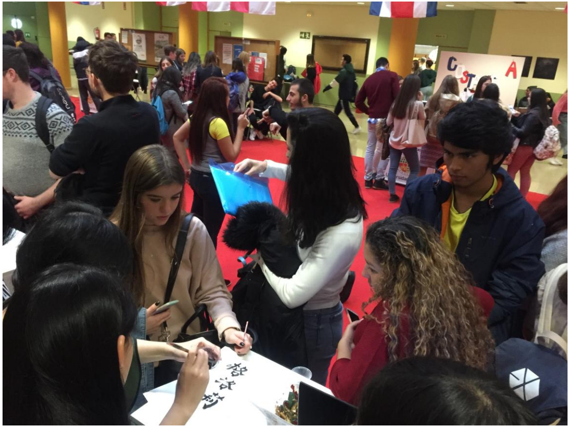
外國人對於繁體中文很感興趣，他們很想把自己的名字刺在身上，於是我們攤位上寫毛筆的地方全程大排長龍