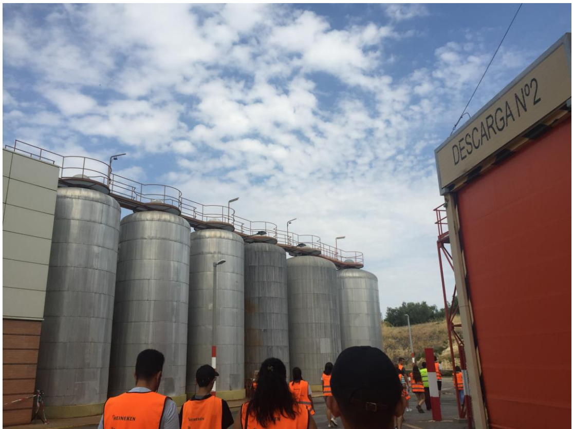
參加 ESN 的哈恩酒廠導覽