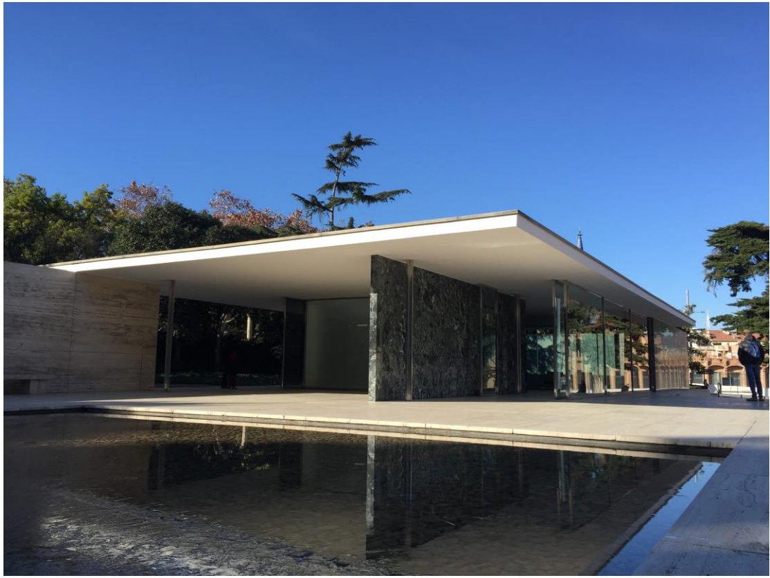
巴塞隆納 Mies 德國館，現場見識到材料與構造搭配之美