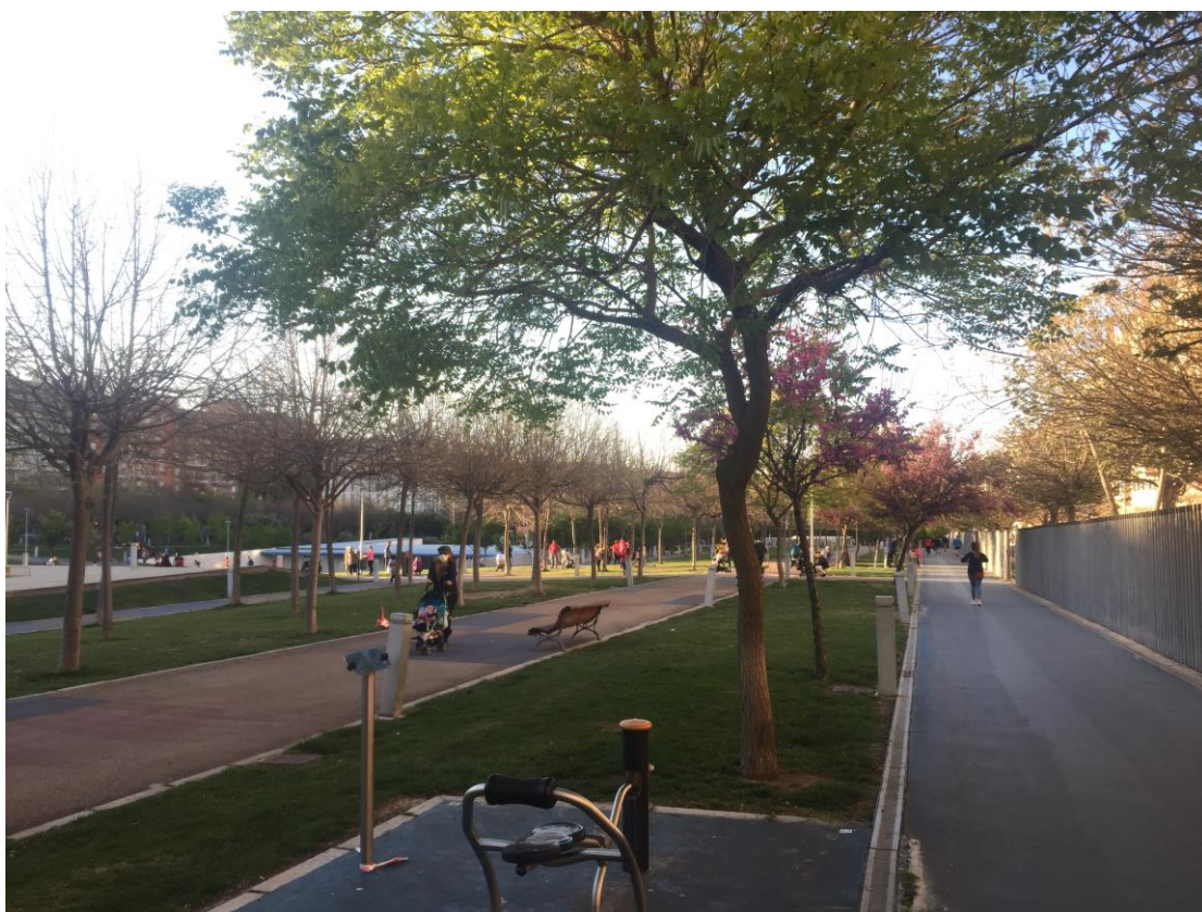
傍晚時的公園，公園內有戶外健身的器材