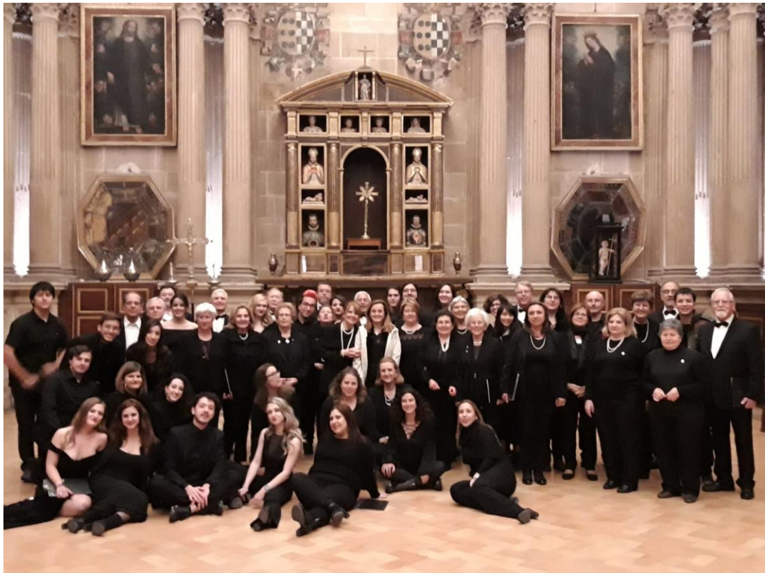
我參加哈恩大學的合唱團，連同哈恩的社區合唱團一起到教堂表演