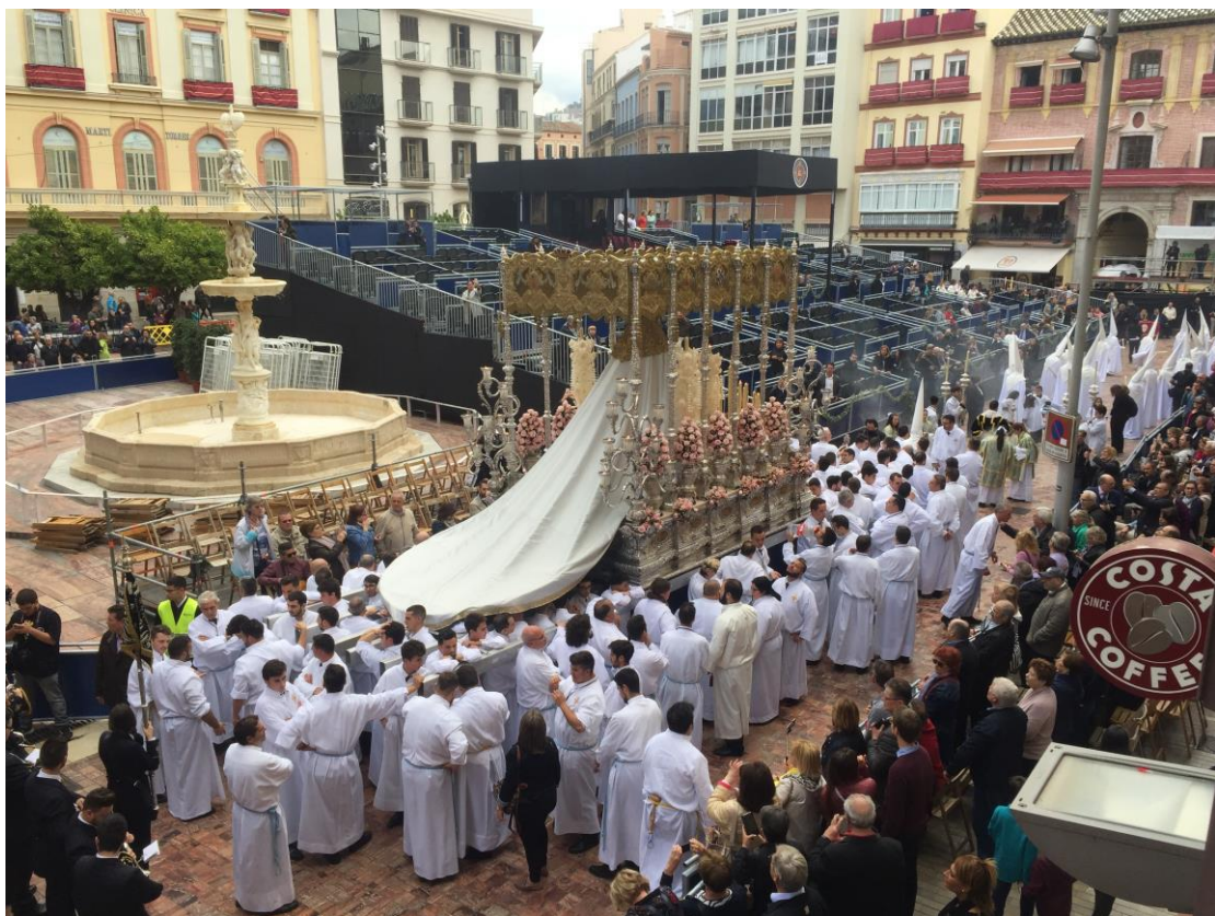
押隊的是聖母瑪利亞