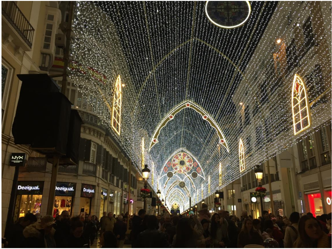
聖誕節馬拉加的燈光秀