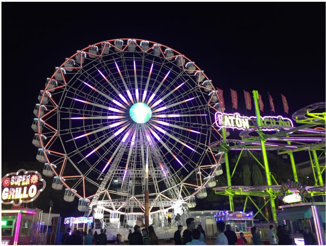
在這禮拜內園區會 24 小時營業，非常好玩