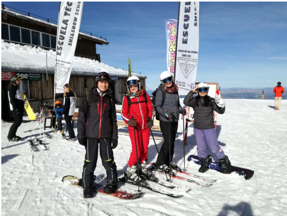
西班牙內華達是唯一可以滑雪的地方，我跟著旅行社及朋友上去滑雪