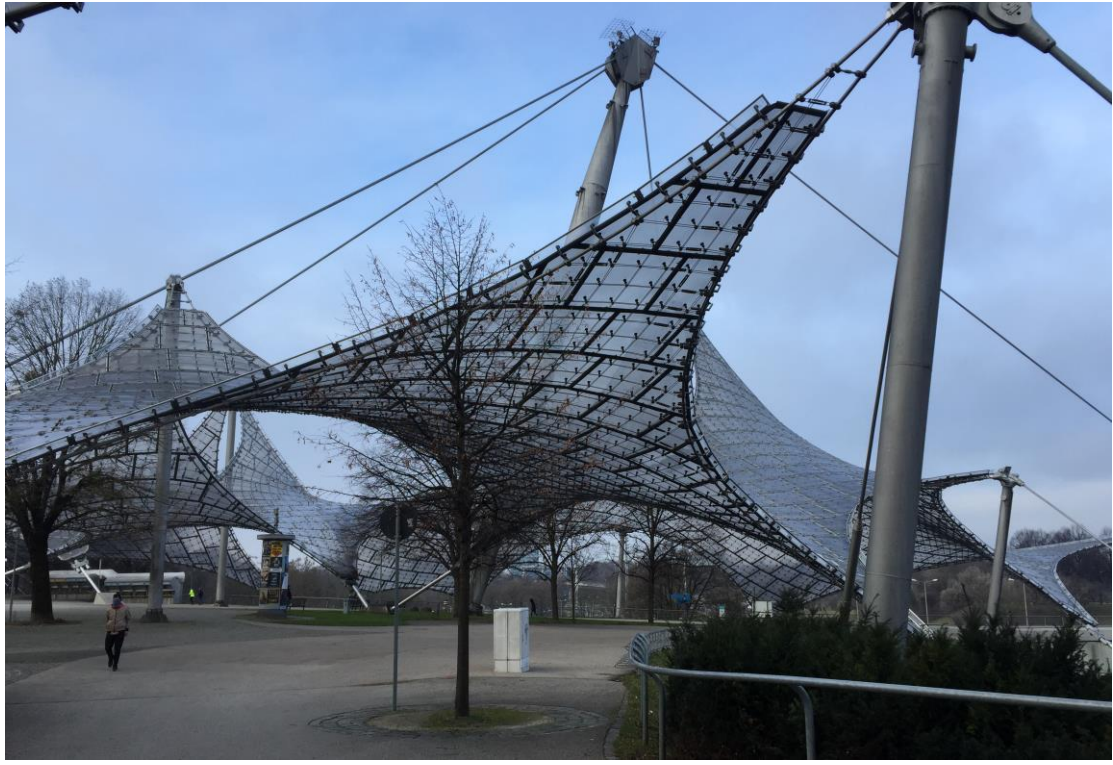
慕尼黑奧運公園，為帳篷系統非常成功的案例