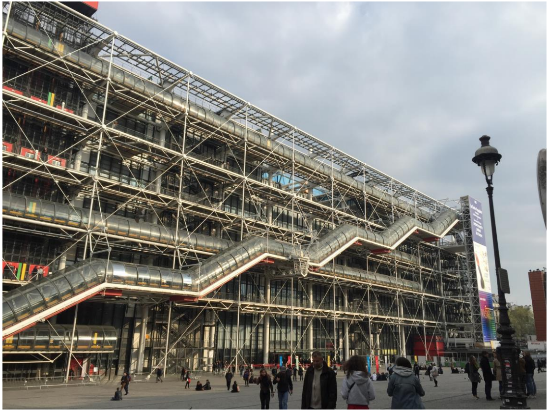
巴黎的龐畢度中心，為現代建築立下一個里程碑