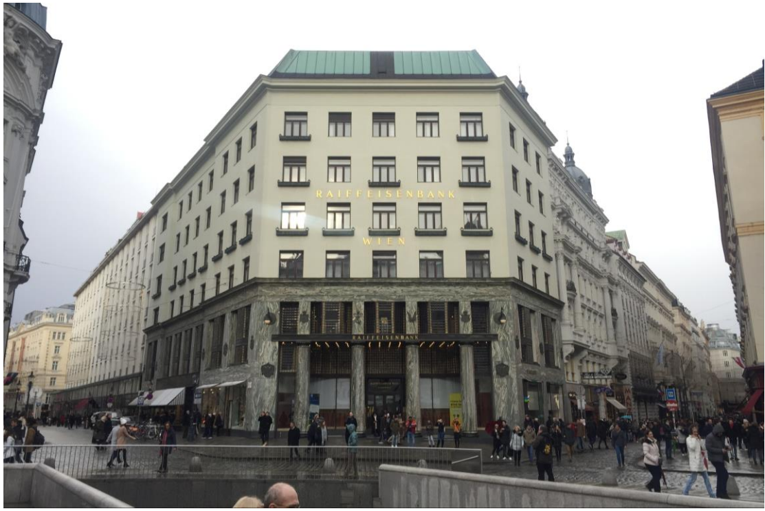
位於維也納，阿道夫魯斯的經典之作，記者形容其像是水溝蓋