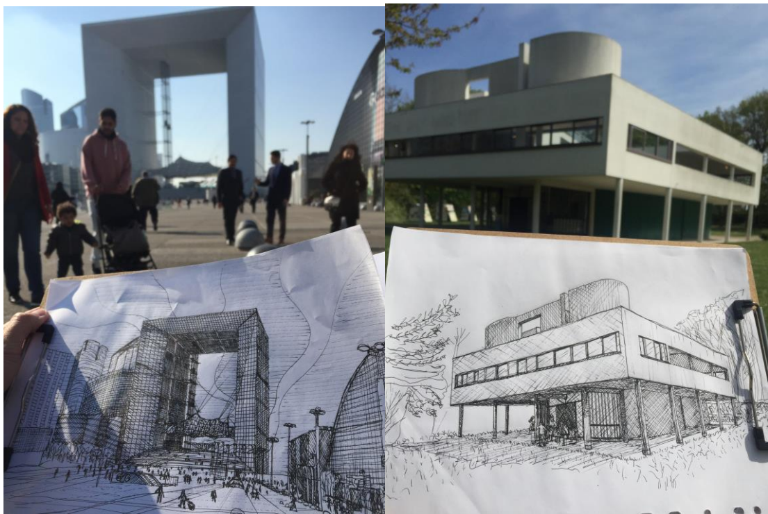
位於巴黎的新凱旋門，以及巴黎近郊的薩伏伊別墅