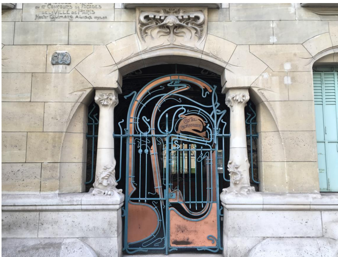
法國巴黎 Guimard 在新藝術運動中的經典設計