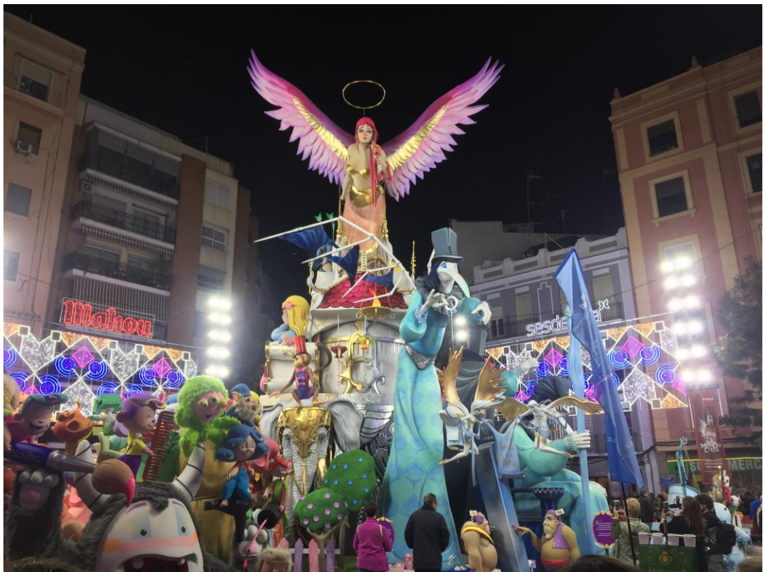
這些木偶或紙偶會在最後一天聚集在廣場焚燒