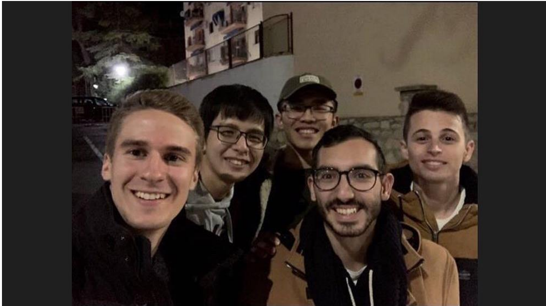
我與兩個義大利室友(右一及右二)