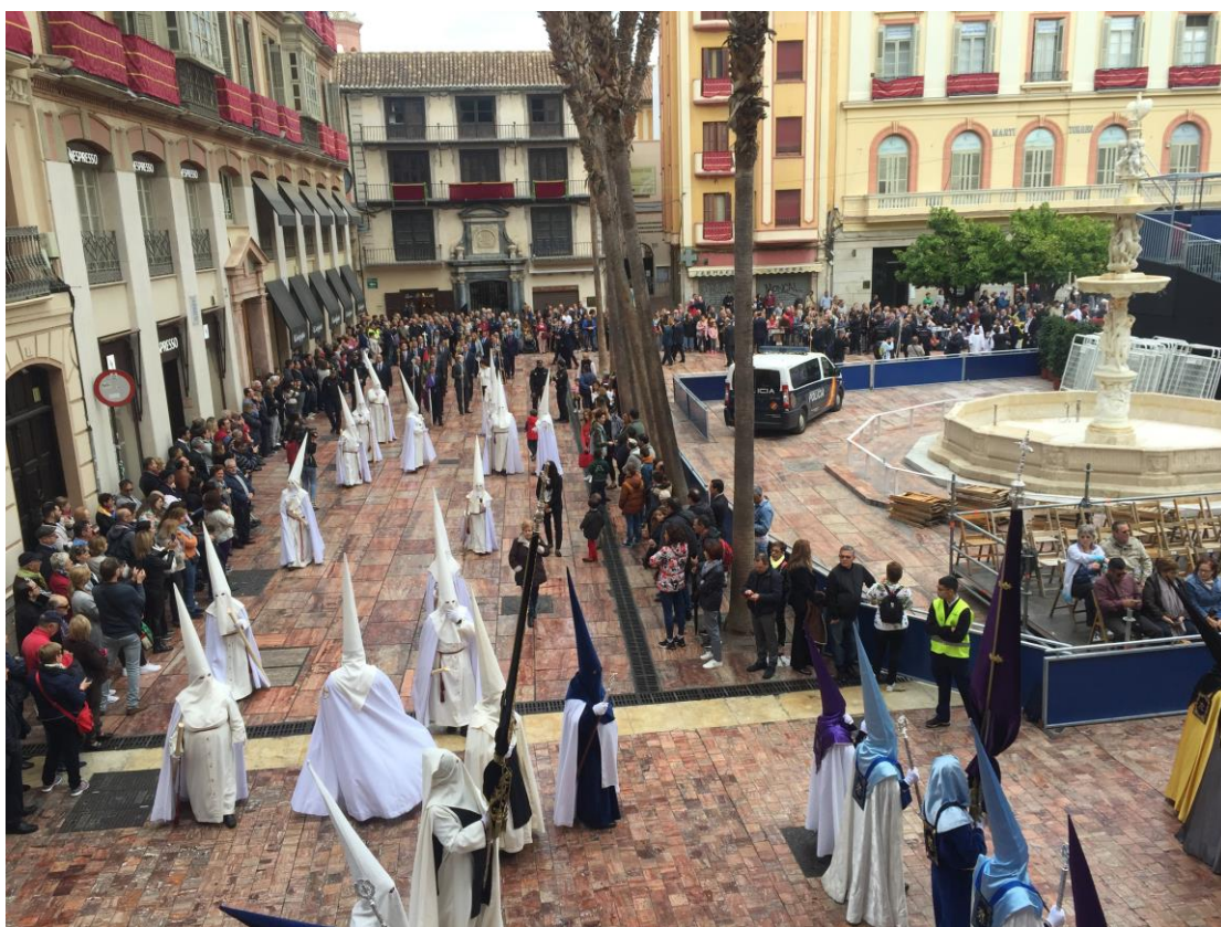
聖週時馬拉加的遊行，那天是聖週的最後一天，耶穌復活的日子