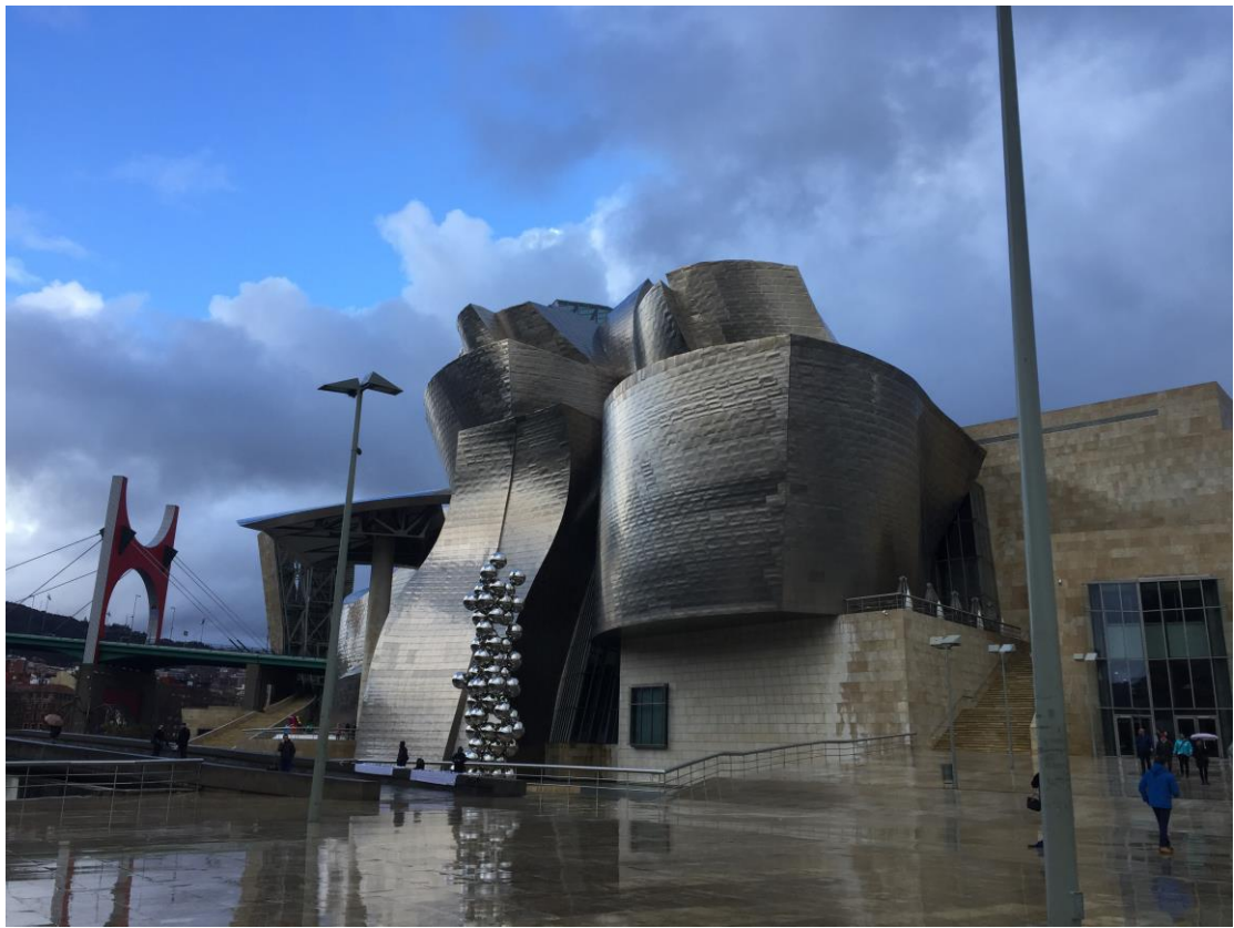
畢爾包古根漢美術館，Frank Gehry 的經典設計之作