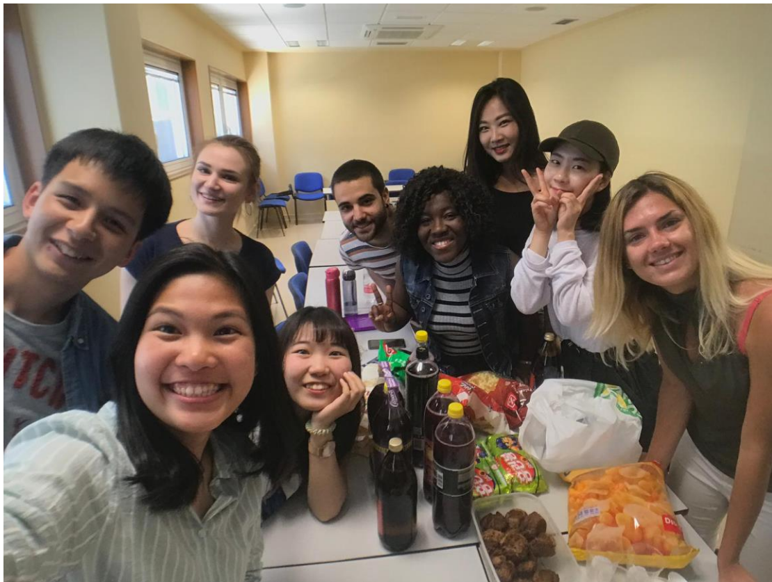
下學期課程結束時與老師的課後聚餐