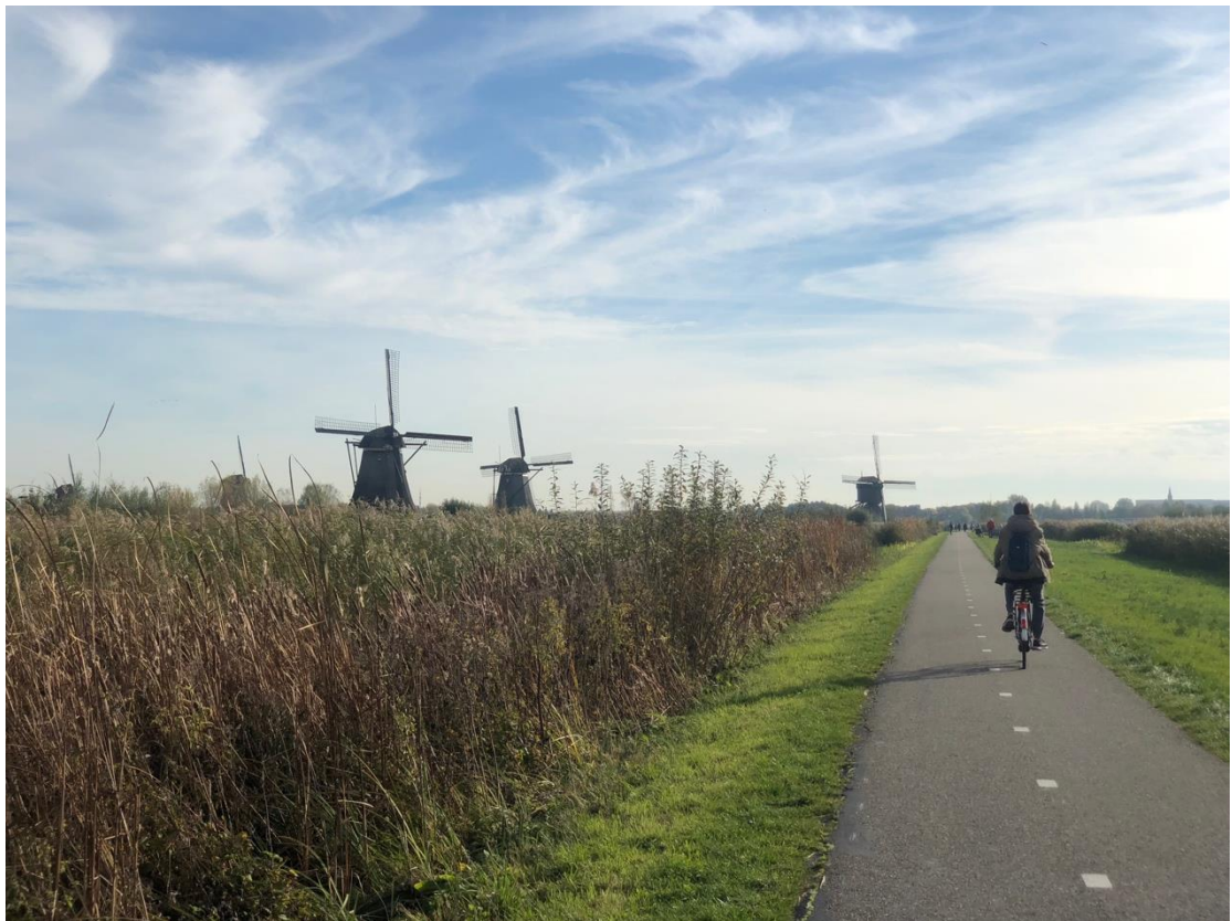
（上圖）參觀荷蘭世界遺產——小孩堤防