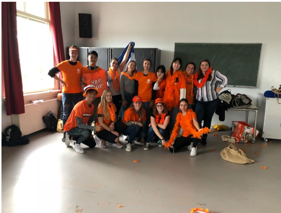
(上圖) Introduction Day