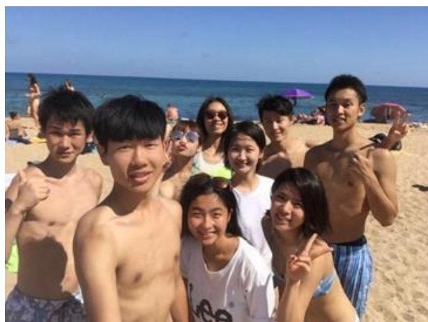
圖 3 學校出遊活動

西班牙與台灣最不同的一點，就是不管怎麼樣星期天任何商店絕對不開門，走在街上彷彿來到空城似的，那你一定很好奇，西班牙人的星期天都在做什麼？像台灣一樣週休二日都躺在床上追劇嗎？當然不是，西班牙人的觀念，放假不應該待在家，悠閒星期天絕對是與家人或朋友相約去戶外野餐，爬山戲水，因此入境隨俗的我，也在星期天報名許多戶外活動，令我最印象深刻