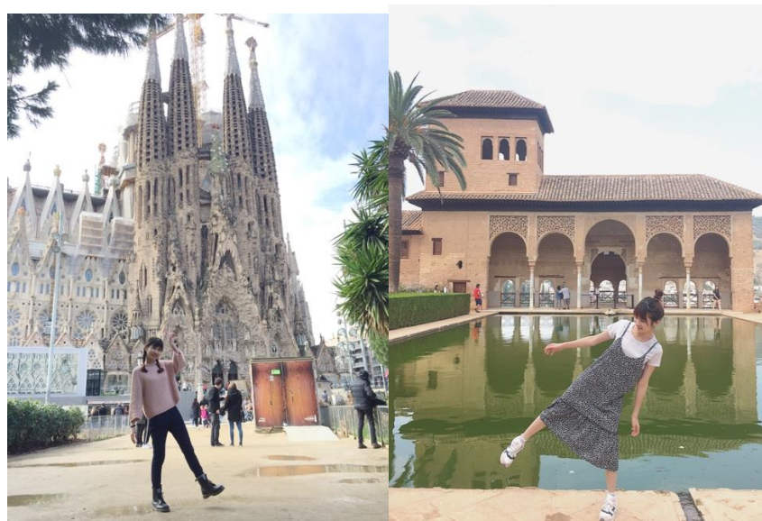
圖 4 左(巴塞隆納)、右(格拉納達)

西班牙很多城市的風貌都不盡相同，每個城市都有自己的特色，像是西班牙南部塞維亞，格拉納達，有許多阿拉伯式的建築，你也能到北部沿海的巴塞隆納觀光，看看壯麗的高第建築，西班牙境內的旅遊除了可以搭乘火車，巴士，還有一種交通方式 blablacar，類似 uber 共乘機制，這三種交通方式任君挑選，各有優缺點。