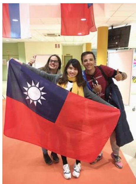
圖 2 國際料理交流活動

國外的學生都相當熱愛運動，以足球聞名的西班牙當然也不例外，學校提供各種運動的選擇，像是健身房，瑜伽課，韻律課……等，任何課程都能自由選擇，原本在台灣的我是個極討厭運動的人，來到歐洲後，朋友們都鼓勵我去健身房。