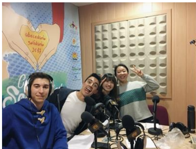
圖 6 哈恩當地廣播體驗

回想起來，這幾個月改變我許多，一開始害怕膽小的我，連幾句英文都不敢開口跟外國人講，這是自己選擇的，必須獨力面對，慢慢調適心情，學會融入環境，一眨眼時間就過去了，短短的這幾個月讓我收穫滿滿，在國外居住一段時間會發現，有些風俗民情並不是能透過旅遊來得到，必須長時間居住在這裡，融入當地的生活，得知了不同的價值觀，深深體會國際觀的重要性，除此之外，也使自己變得更獨立，要在完全陌生，沒有人認識你，又必須用第二外語溝通的國家生活，必須有顆強壯的心，食衣住行都靠自己打理，遇到問題想辦法找出解決方法，或是尋求陌生人的幫助，同時交到了許多好朋友，我的幾個西班牙好朋友，甚至還跟我玩語言交換的遊戲，他們想學中文，我也想練習西文，不僅如此，他們對於台灣的文化，食物，歷史也相當有興趣，每當我講到我的故鄉時，都會發現他們聽得津津有味，讓我相當的感動，雖然台灣在國際上很渺小，但就是需要我們這些在異鄉的學生，幫忙宣傳，讓歐洲認識台灣，讓全世界認識台灣，這段時間明顯感受到自己成長許多，心智也更加成熟，這些可貴的經驗是一輩子在台灣都得不到的。