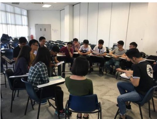
全班同學每一次的團體練習合照