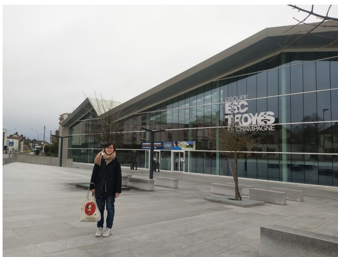
Groupe ESC Troyes En Champagne 學校大門