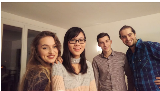
與室友最後一次聚餐合影