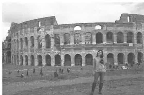
歷史上著名的羅馬競技場