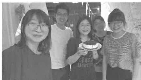
此次一同到荷蘭交換的台灣朋友