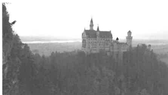
德國美輪美奐的新天鵝堡