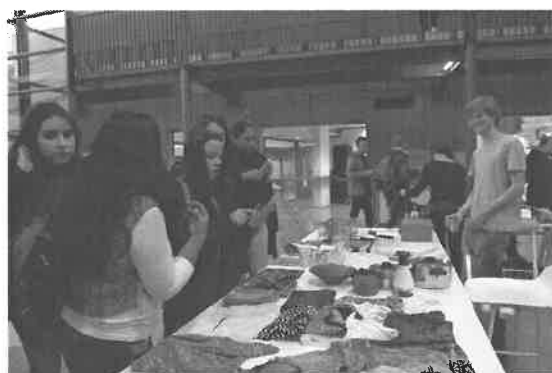
與課程同學共同籌備的跳蚤市場活動