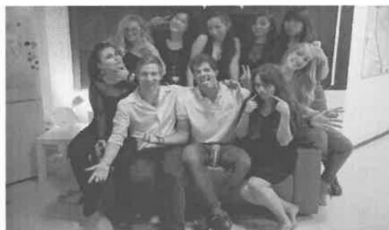
與戶友們一同籌備派對