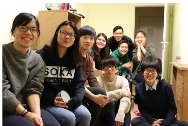
與朋友們最後一次聚餐