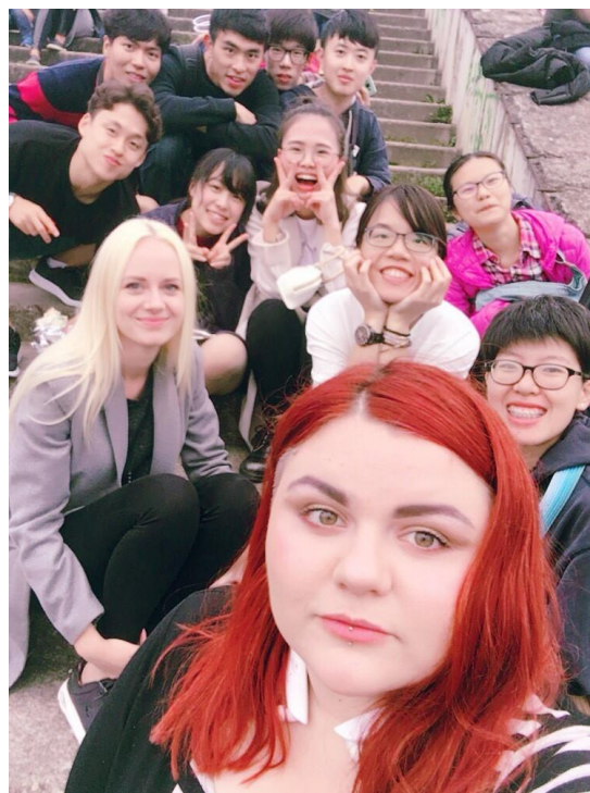
與學伴及其他交換生合影

課程方面，都是與來自世界各地的交換生一起上課，立陶宛文課是小班教學，座位安排是以圓弧形狀擺設，如此一來老師可以關注到每位學生，也會讓每人輪流回答問題。老師總是鼓勵大家不懂就主動問，因此她只會講解一遍課程內容，也不太會複習上一堂課所學。藉此體驗到立陶宛的上課方式，以及國際學生在生活、認知等各方面的不同，並學習國際學生們主動發問的精神。