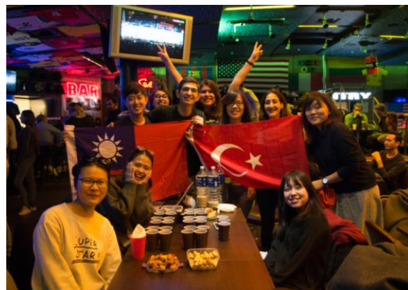
與土耳其交換生合影

在交換期間，很幸運地遇到上了立陶宛的國定假日：All Saints' Day，有點類似台灣的清明節。各地文化對亡者和死亡的詮釋與表達的確很不同，台灣掃墓是燒香拜拜，11/1這天立陶宛人則是會去先人的墓上點蠟燭和放鮮花，到了晚上遠遠看過去整個公墓像是一片蠟燭海，閃亮的一大片燭光和聚在一起的人群們，明明是公墓卻有溫馨的感覺。