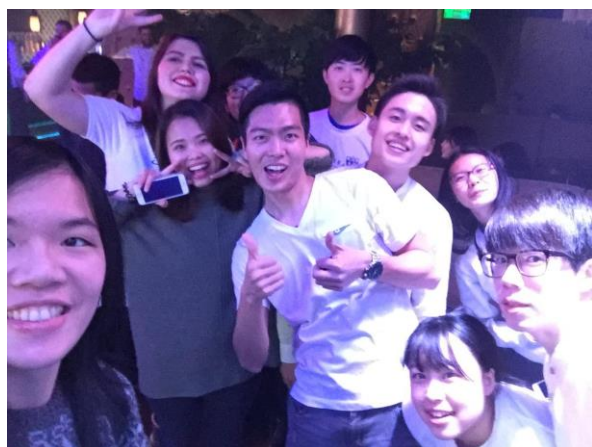
與朋友們在 goodbye party 合影

一學期的交換生活很快就畫下句點，彷彿是誰按下了快轉鍵，如煙火般絢麗，卻是短暫。感謝這半年遇見的人事物，感謝一路上我很幸運遇到了許多幫助我和支持我的朋友，讓我的交換生活更為精彩。這一趟旅程意義非凡，用了很多不一樣的回憶告別我的學生時代。我不僅學了立陶宛文，也更認識立陶宛這個遙遠卻充滿人情味的國度，更交到了一群珍貴的外國朋友。對我來說，立陶宛就像是我的第三個家，在那裡，有我半年留下的腳印，有我的朋友。我會想念那裡的一切，也希望能有機會再造訪立陶宛。很感激在大學期間，能有這樣的機會讓我出國學習。接下來要邁向人生中另一階段，希望能保持自己的生活態度，享受未來的工作就像享受學習和旅行。