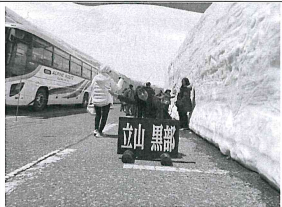
利用黃金周去立山黑部玩