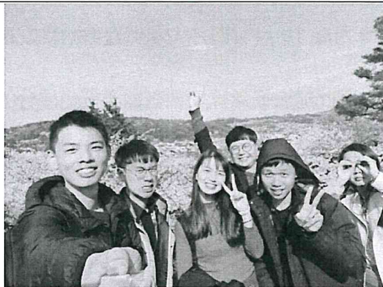
去的時候剛好是四月，去賞櫻花