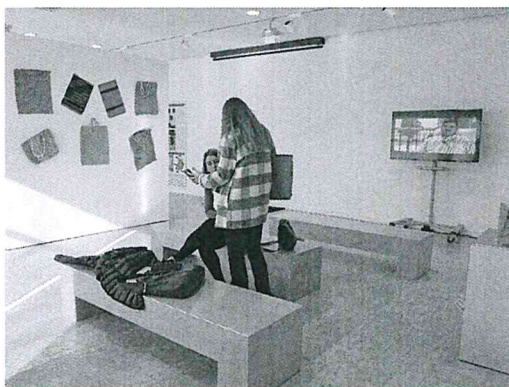
瓦倫西亞博物館 展場分析

另外每位交換生都必須選擇西班牙文課，我在得知要前往西班牙時，就有選修語言中心西文A1課程，為我留學前做準備。實際上，我在西班牙的第一堂西文課還是聽不懂，但有基礎還是幫助我快速學習。老師授課方面強調對話，所以課堂上大部分都在練習日常對話內容，這在日常購物、點餐有很大幫助。最終老師要求我們使用半年所學西文單字，做一場介紹自己國家的簡報。