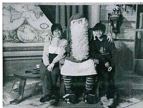
芬蘭之旅-聖誕老人村 (自由行) (旅行台灣最佳夥伴)