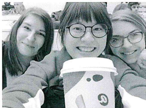
Orientation Week (波蘭室友 & 斯洛伐克女孩)