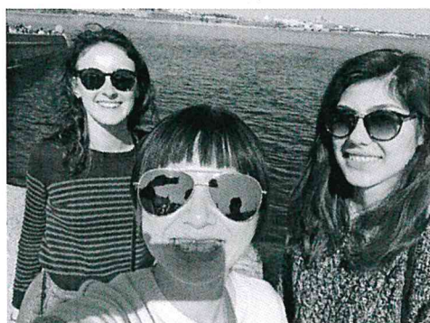
俄羅斯-聖彼得堡之旅 (ESN) (法國室友 & 義大利女孩)