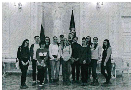
參觀立陶宛總統府 (法國室友&她們朋友們)