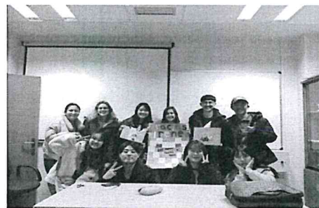
(第一學期的西文正規班結束與老師拍照)