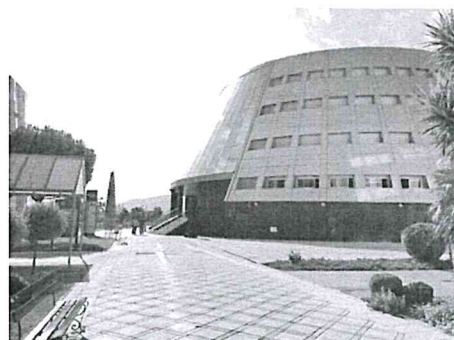
(哈恩大學最為象徵性之建築物,別名:飛碟、布丁)

哈恩大學是一所西班牙公立大學並位於南部安達魯西亞自治區哈恩市,共有五個學院(社會和法律科學,人文和教育科學,健康科學,實驗科學與社會工作)和一個附屬中心並提供超過 40 個學位。根據 2019 泰晤士高等教育世界大學的排名,哈恩大學位於世界上最好的大學的 801-1000 區間,並且排名西班牙大學的 15 名。