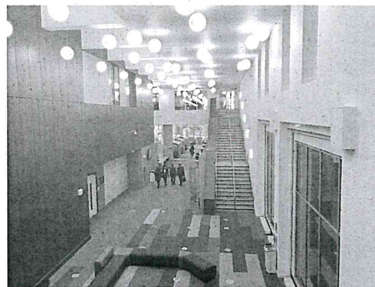
上圖為 Curzon Building 的內部空間