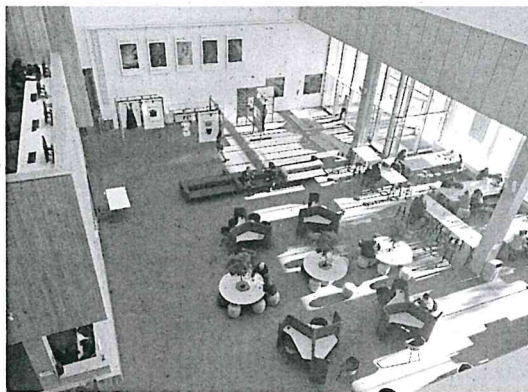
上圖為 Parkside Building 的內部空間

以音樂及藝術聞名的伯明罕城市大學 Birmingham City University (BCU) 最早可以追溯到成立於 1843 年的伯明罕藝術學院 (Birmingham College of Art)，而目前最廣為人知的就是他們的珠寶設計學院，許多人為了此科系專程來就讀這間學校。直至目前為止，該校在伯明罕有七個校區，也是該城市中第二大的學校。這次我是在他們 2013 年剛蓋好不久的校區 Parkside Building 和 Curzon Building 上課，大樓裡面採挑高設計，室內採光良好，硬體設備也很完善。學校的圖書館除了國定假日基本上都是 24 小時開放的，室內也有規畫許多可以多人討論的小屋子和個人座位讓大家能夠輕鬆自在地在這個空間做自己想要做的事，而且幾乎每一層樓也都設有販賣部，不用害怕餓肚子。Curzon Building 的一樓常常都會舉辦一些活動，例如愛心義賣、二手小市集等等，也會根據不同節慶舉辦不同的活動。學校也設有幫助學生課業的組織，第一次自己寫一大篇文章不用害怕寫不出來，如果不知道怎麼引用文章或者是註解的話也可以和他們預約時間一對一輔導。