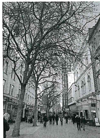
上圖為攝於二月份在伯 明罕人來人往的街道上。