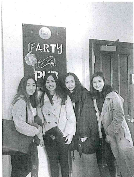
下圖為交換生歡送會時所拍