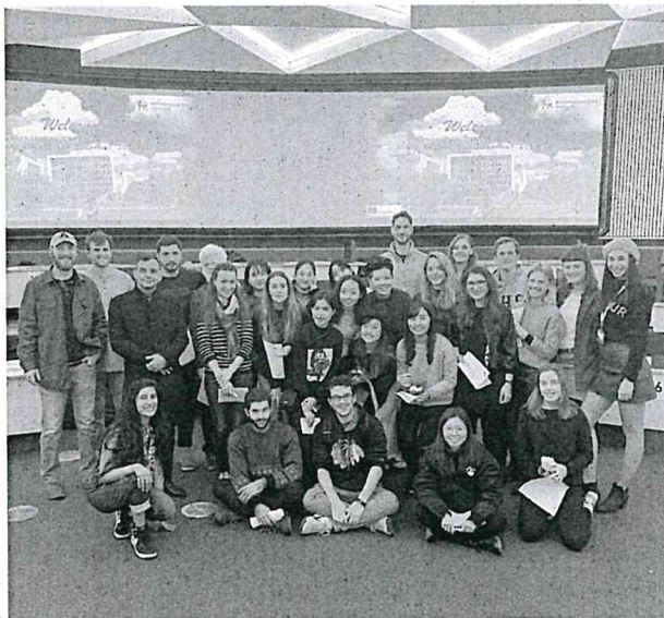
上圖為交換生歡迎會時所拍

當交換學生的這段日子使自己更加獨立，也學會了如何與自己獨處。在這裡沒有人會在旁邊提醒或交代你要做甚麼事，時間運用非常的自由，所以玩樂和讀書的時間分配非常的重要。我還有發現自己的適應能力還不錯，生活上沒有太大的困難。語言能力的部分也適應得還不錯，雖然有時候音調還是會跑調，但個人認為自己有學到一點英式口音的精隨，如果在那裡交換一年的話成效也許會更大也說不定。在這裡也認識了許多來自不同國家的朋友，文化與文化間的碰撞非常有趣，不僅拓展了自己的國際視野還有學習理解各個國家不同的文化。