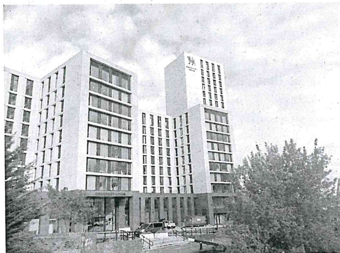
左圖為學校 2016 年剛蓋好的宿舍，也是我住宿的地方，走路只需要三分鐘就能抵達我上課的大樓。

在英國使用信用卡比使用貨幣還要方便，如果將信用卡綁定在手機裡，出門也不用帶錢包了，而且有些公共廁所甚至提供刷卡服務，真的是讓人大吃一驚！除此之外，英國本地人其實很少用到 50 英鎊大鈔，如果可以的話在台灣換錢時盡量換成 20 英鎊紙鈔會比較方便。（有些自動結帳櫃台連 20 英鎊紙鈔都不收，這時候就要找一般有人的櫃台了）不過這項便利的科技在蘇格蘭地區可能就沒那麼方便了，蘇格蘭有些地方還是會以紙鈔為主。