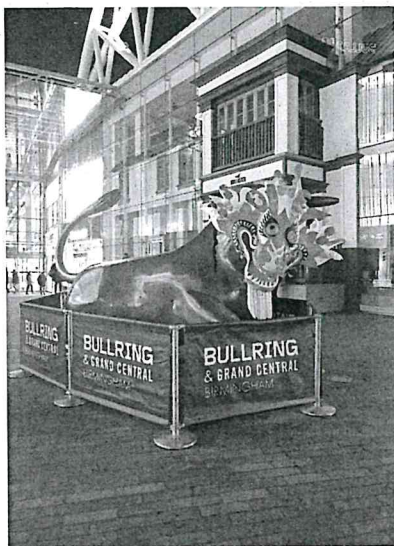
上圖為伯明罕百貨公司 區街道上無人不知無人不曉的公牛，常常作為碰面地點的知名地標。

這次能到英國交換對我來說一定是一個一輩子最難忘的經驗。由於英國的交換名額並沒有每一個學期都有開放，加上交換名額數量稀少，因此申請的時候非常緊張。好不容易申請上了又是另一項挑戰，除了需要開始頻繁地和對方的國際事務處相關人員用 E-mail 溝通，還需要準備很多資料如過海關時的財產證明書、保險、學校錄取信等等。到了伯明罕以後，我大概用兩、三個禮拜才漸漸適應當地的口音，因為伯明罕除了當地人，中東裔及印度裔也佔大宗，不用說整座城市，光是在學校裡面就像個小型聯合國，所以每個人的口音都不太一樣，但是習慣以後就沒什麼問題了。來伯明罕不用擔心買不到日常生活用品，作為英國的第二大城，離學校走路約 15 分鐘的距離就能到最熱鬧的百貨公司區和小市場，也是我們俗稱的「Bull Ring」，如果懷念家鄉味的話，只要再走個五分鐘就能走到中國城了，非常的便利。除此之外，由於伯明罕在英國的中部，因此搭火車到英國其他主要城市旅遊的時間平均都在二~三個半小時之間，雖然聽起來蠻久的，不過以歐洲來說其實還挺快的。我自己也有利用復活節假期和回台灣前的假期與朋友一同到歐洲自助旅行，整段過程都令人難忘，從一開始去冰島前航空公司破產倒閉以至於要臨時重新買一張機票到最後的義大利看到了許多之前只在課本上看到的歷史地標，每一段從無到有的旅程除了提升自己規劃的能力還增加了自己的見識，而且到非英語系國家就會發現英文真的很重要！不然真的會很容易會有雞同鴨講的情況發生。此外，也謝謝自己願意跨出這一步，第一次自己搭飛機到離家幾千公里外的陌生環境展開一段新生活是個很大的挑戰，很高興在這段期間沒遇到甚麼不好的事，最後也平平安安地回到台灣。世界這麼大，出去走走是個很好的選擇！