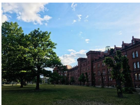
布蘭登堡應用科技大學-管理學院

1992 年 4 月成立於哈弗爾河畔的布蘭登堡市。如公園般舒適、綠蔭密布的校園內，以現代風格的教學大樓和先進的實驗室，開設工程、商業管理、經濟、資訊科系及媒體等專業課程，有超過 2700 名學生在此進行學習和研究活動，為德國及台灣教育部認可的公立大學。