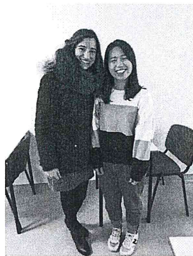
(與口說課老師合照)

哈恩大學對於交換生修課沒有太多限制，學生可依照自己的興趣修習課程。西文的部分有六個等級(A1、A2、B1、B2、C1、C2)，哈恩大學將每個等級再細分(A1.1、A1.2、A2.1、A2.2...)以此類推的正規課程，另外還有口說、寫作、文法課以及 DELE 準備班，提供學生從多方面學習西文。於學期初會有一個能力測驗分班，依照學生的程度進行分班。本學期修習的課程皆為西文課：正規課 A1.1、西班牙文口說、西班牙文文法