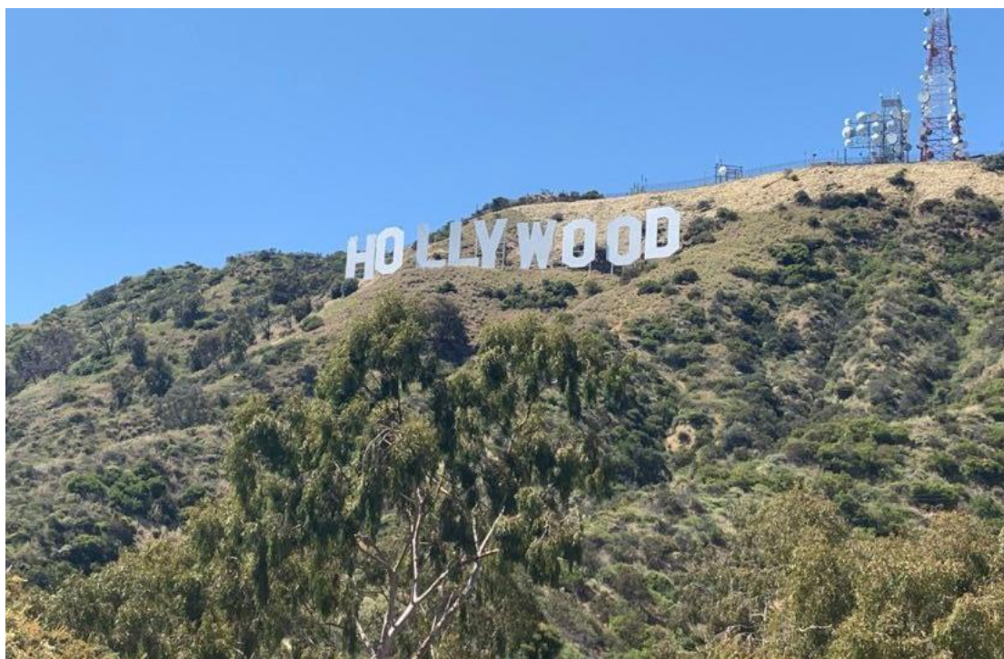
Holly Wood Signboard