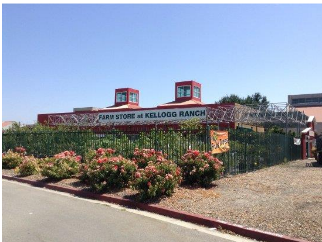
CPP Farm Store