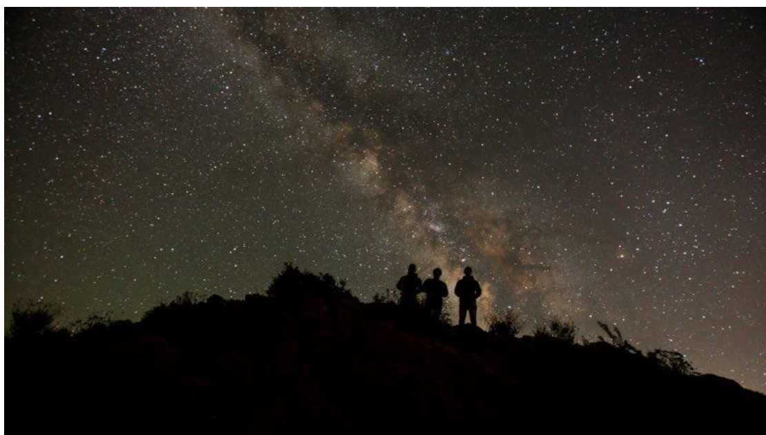
Galaxy in Joshua National Park