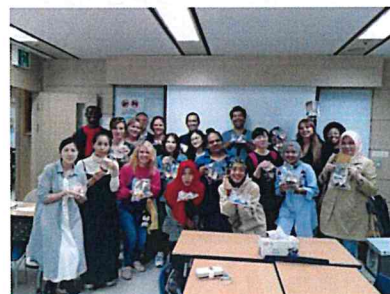
(文化課程全班合照)