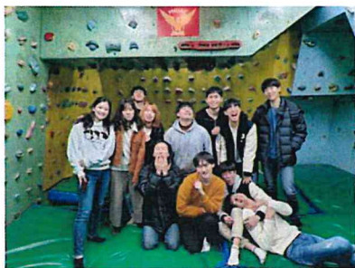
(登山社部分社員合照)

另一個參與的社團是登山社，誤打誤撞地闖進的登山社是我交換期間最大的自我突破，社團內除了我與兩位台灣友人還有兩位日