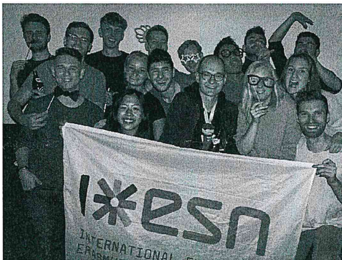
Figure 5 ESN Party Time.

而這半年帶給我的最大收穫，大概是更加的獨立吧。無論是初來乍到自己安頓一切、假日旅遊的行程規劃、生活上與來自各國同學的交際應對，都使我更能獨立思考，也更加認識自己。而旅程中走過的國家，也讓我有很深的感觸，這些國家對我而言，不再是課本雜誌上看過的”名詞”，而是真真切切、一個又一個文化搖籃，建築風格、飲食習慣、休閒娛樂、生活態度上都有著明顯的差異，跨了邊界好像換了一個世界，種種發現都帶給我很深的感動與震撼，也讓我更懂得尊重、包容、與珍惜這些差異。