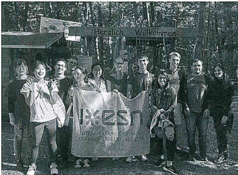
Figure 4 ESN 森林團康活動。