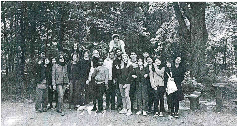
Figure 2 德文密集班校外教學，到達姆附近的森林健走、學德文。

這次交換半年主要的目的，於公，是要完成系上畢業門檻，於私，是想趁著學生身分到處走走、增廣見聞。這個學期，我仍舊想以商業課程作為主修，而 h_da 的商學院在 Dieburg 這個小鎮，距離達姆城大約一個小時的車程。本學期商學院以英文開設了四門課，包括 Business English/ Management, Organization and Leadership/ European Economics and Politics/International Business Research Methods。但因開設課程不能與雲科學分相抵，最後只選了德文課與商業英文兩門課。值得一提的是，h_da 在開學前三周，按照德文程度開設了給外籍生和交換生的德文密集班，密集班的課程是週一到週五早上 9 點到中午 12 點 45，除了能讓你在短期內大量接觸日常德文單字跟用語，也能在課程間促進和其他交換生的感情，我覺得這是個很棒的媒介與機會。