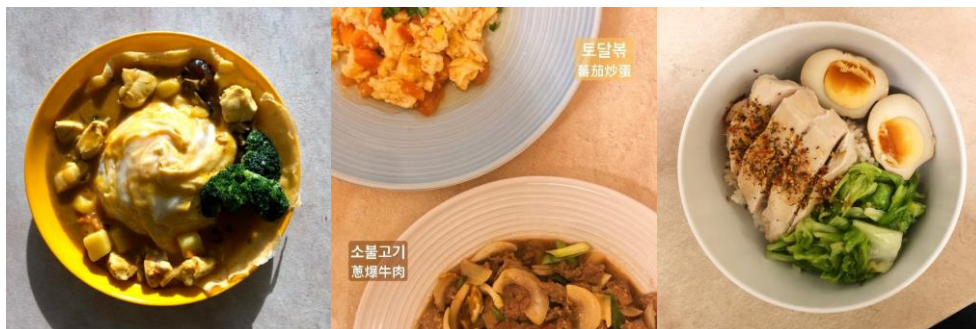
跟室友分享料理順便學韓文

剛到立陶宛時，學校為交換生舉行 Orientation week，內容包括介紹各院及系所、選課事宜、發 sim 卡、ISIC 學生證(含交通卡)、市區觀光與 Welcome party 等，最後一天是與學伴的時間。那天剛好下雨，所以我們學伴帶我們去溜冰。