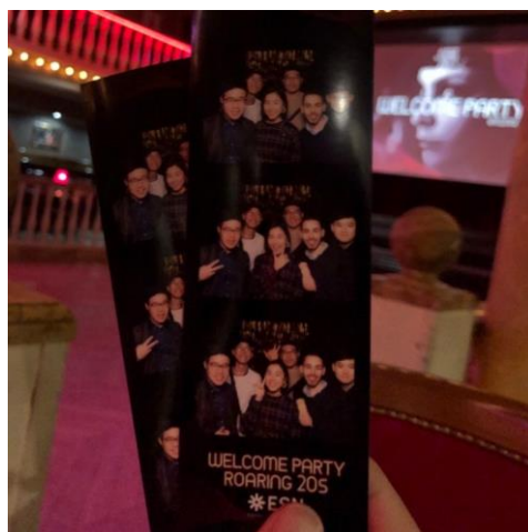
這次的主题是 Roaring 20's ESN 還有租快拍設備供大家留念~