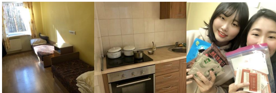
房間、廚房（鍋子是之前該房的交換生留下來的）、室友

最後再介紹一下宿舍，兩人一室，可以選擇是否跟同國家的人一間房，但不一定會有，宿舍也很搶手，所以在學校一開放登記就馬上填寫資料！！我住的宿舍是一個月 150 歐，每週都會有 housekeeping 來清掃地板，還可以換床包枕套。我的室友是韓國歐膩，人很好～也建議可以帶一些伴手禮給室友！