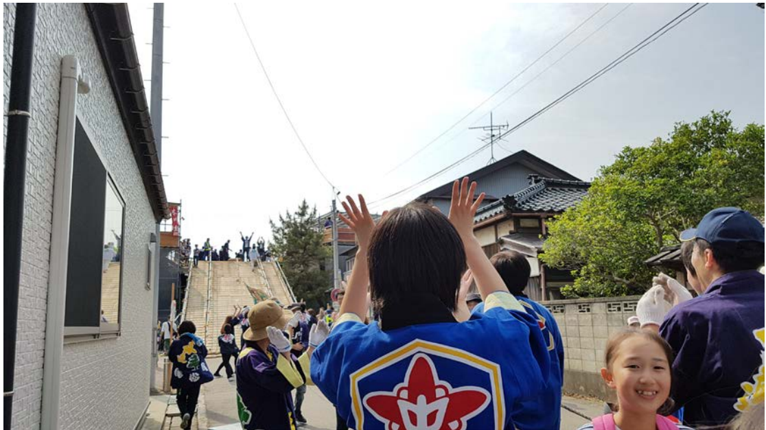
▲在新潟白根的傳統祭典「白根大風合戰」，也一起與當地人參與了這個競賽