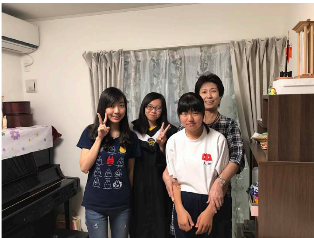
▲與同行的台灣留學生一同和寄宿家庭的家人們共同度過了一個假日，也體會到了日本當地人的平日生活。