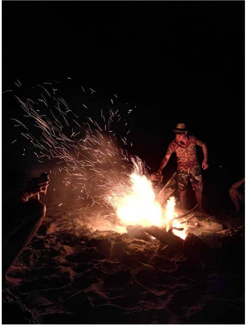
▲與同為留學生的德國、美國、英文、中國、日本當地學生一同在離新潟大學不遠處的日本海海灘一起搭篝火。