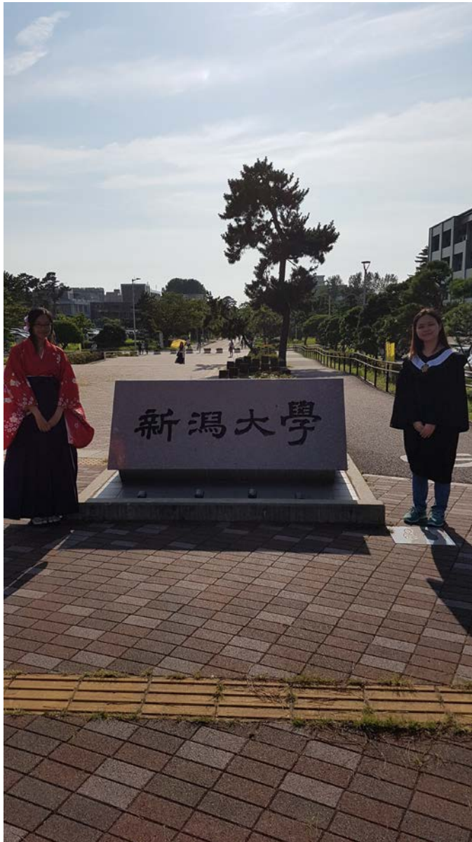
▲一同在新潟大學交換的雲科學姐一起拍了畢業照，也穿上了日本當地的卒業式服裝「袴」