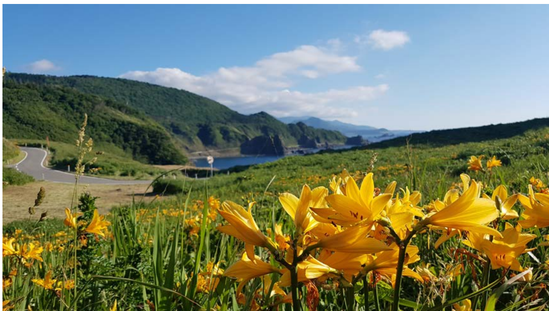
▲位於新潟佐渡上的大野龜，在5到6月盛開的萱草會佈滿整個山野。