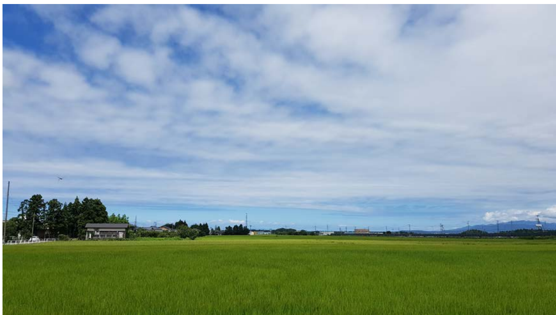
▲新潟的風景放眼望去，常常是一片藍天與綠地。與車站借用腳踏車，騎了一個小時到達了位於山中的「シンクルトン記念館」。