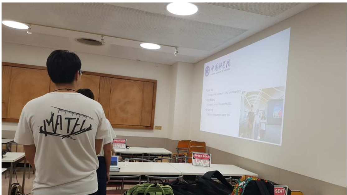
▲與中國科學院等數個中國來訪新潟大學的學生進行交流會。