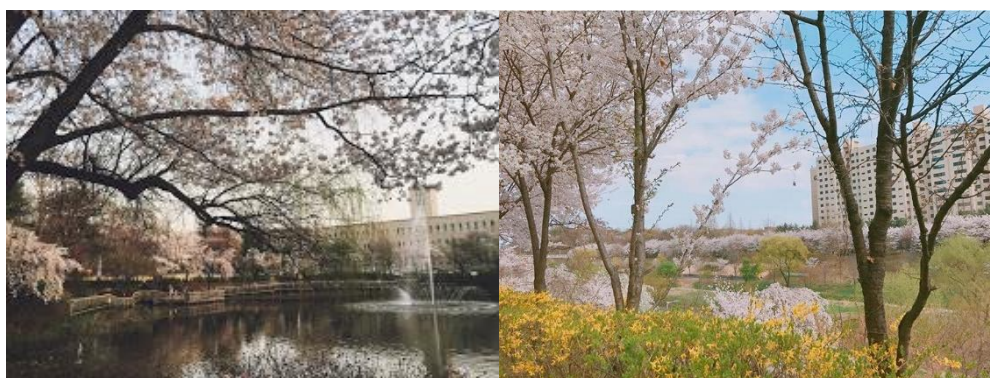
Seoultech 校園內櫻花盛開的面貌

我所交換的學校為韓國國立首爾科技大學(Seoultech),學校位於首爾特別市蘆原區，算是首爾的近郊，附近有各式各樣好吃的餐廳可以選擇，住學校宿舍有學生餐廳可以利用，依據自己的需求選擇是否需要訂餐，只有有訂餐的學生才能進入食堂吃飯。交通方面，學校附近的有地鐵和公車可以搭乘，生活機能算是不錯。校園內有著許多花草樹木，春天的首爾科大綠意盎然使人愜意，四月中旬還有美麗的櫻花伴隨，隨著不同季節的變化也會展現出不同的風貌。