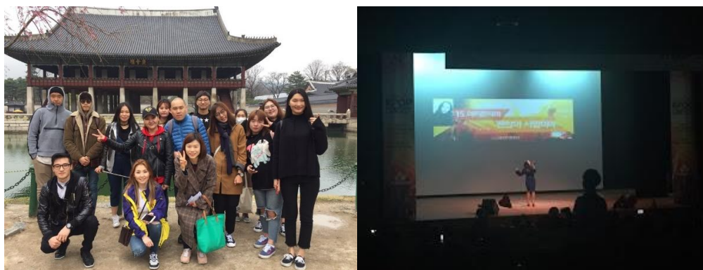
與語學堂同學們和老師一起去景福宮(左)與觀賞語學堂為外國人舉辦的 K-POP 比賽(右)