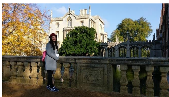
劍橋大學國王學院