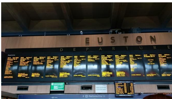
London Euston 倫敦大站車站大廳時刻表