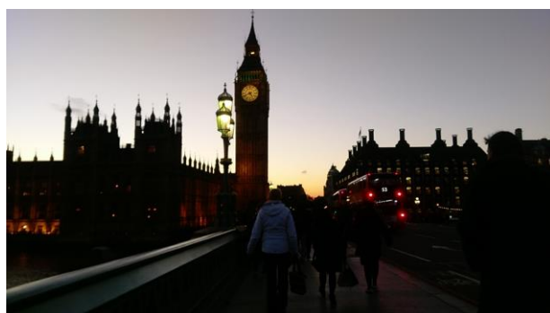
倫敦大笨鐘與西敏寺