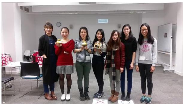
BCU Taiwanese 台灣學生會聖誕派對