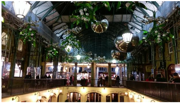
柯芬園 Covent Garden