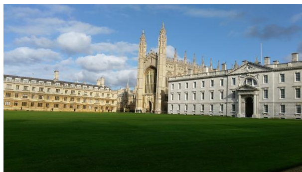
劍橋大學三一學院