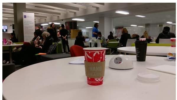
BCU BLSS 學院咖啡廳