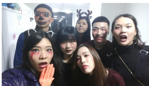
BCU 萬聖節 party