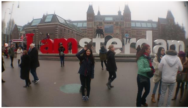
阿姆斯特丹地標 I amsterdam