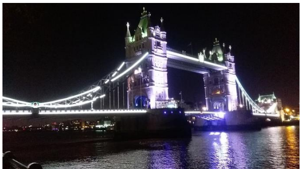
倫敦塔橋 Tower Bridge