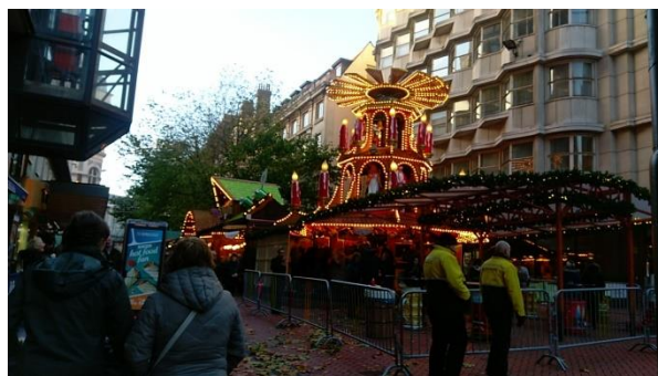
伯明罕聖誕市集 11 月中旬至 12 月底