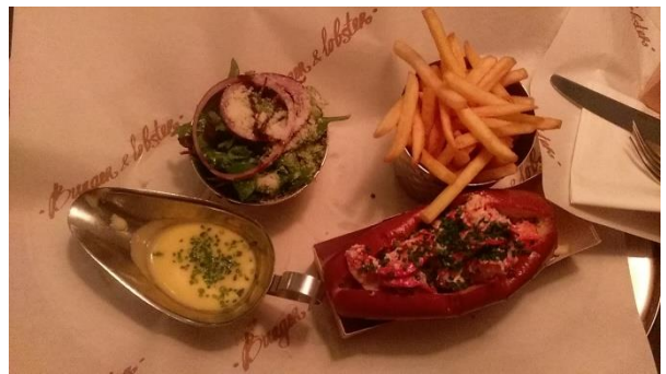
倫敦美食龍蝦三明治 Lobster and Burger