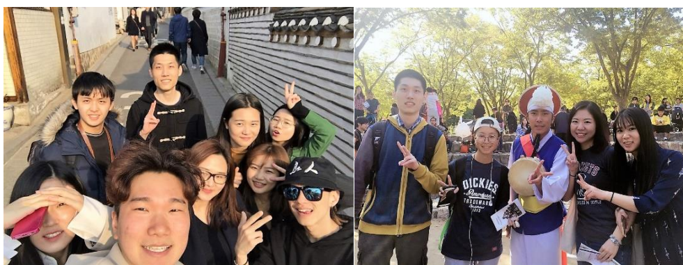
▲與 ISC 學伴出遊