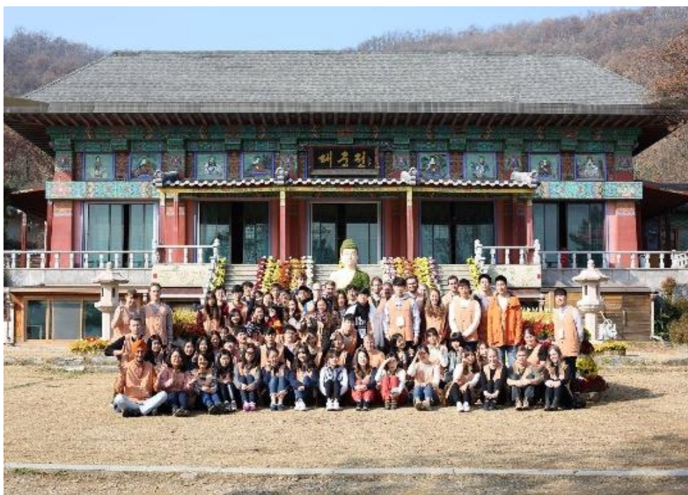
▲ISC 第二次文化體驗 - 金剛精寺

老師、이수현老師，五級班的김경지老師、김민채老師，六級班的박성숙老師、김은선老師。語學堂中國、蒙古、緬甸來的學生，ISC 的成員們，美國、荷蘭、瑞典、中國、捷克來的交換生，跟我一起住過一學期的韓國室友，偶然相遇認識的韓國朋友，在音樂放送現場認識的韓國人、馬來西亞人、德國人、香港人、中國人等等，與每一個人的相遇都是幫助我成長及增廣見聞重要的片段，沒有了他們，就不會有現在的我，我很感謝與我相遇，幫助過我的人。