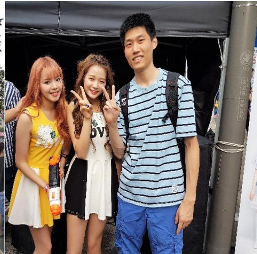
▲與 limesoda 的 승지, 헤림合照

在韓國這一年發生了許多覺得不可能發生的事情，不管是在學習、娛樂上都給了我煥然一新的感受，但總結諸多原因，我還是把這些發生的事情歸功於認真努力學習上面，要是我沒申請到交換生，這些事不可能發生，要是我不會韓文，這些事也不可能發生，在這交換期間要過得怎麼樣，決定權都在自己身上，已經抓到了機會出國了，千萬不要因為小事情而錯失了美好的機會，也不要沒自信、害臊誤了自己，不管怎樣，有想法有目標，先做就對了，沒行動永遠只是紙上談兵。