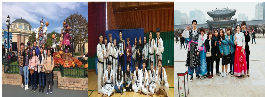
(左到右圖分別為四、五、六級語學堂文化體驗)

在上語學堂的時候，可以依據自己所需申請語言導師，三級以下是學生，四級以上是老師，我個人是有申請覺得幫助蠻多的，每個禮拜可以約見面一到兩次，可以跟老師說一些在韓國的問題或是想要達成的目標，老師都會盡全力幫忙的，像我的語言導師就送我了一本韓文書，書名為一個字，僅僅用一個字道出了人生的道理，老師推薦了我幾個比較好閱讀的章節叫我回去細細閱讀，下次見面則發表一下讀完的感想，來糾正我的發音和表現方法，至今我還把這本書帶著有空時就會閱讀。