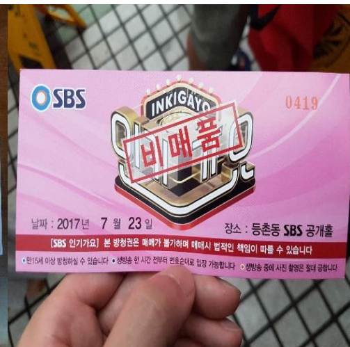
▲SBS 人氣歌謠生放送票券