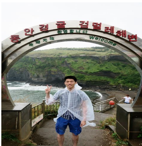
▲濟州島 - 牛島