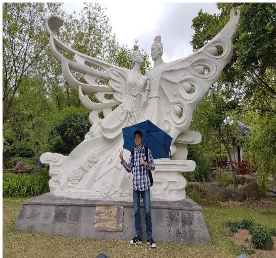
▲順天灣國家庭園 - 梁祝像