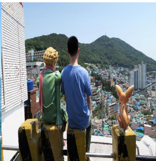
▲釜山甘川洞文化村 - 小王子