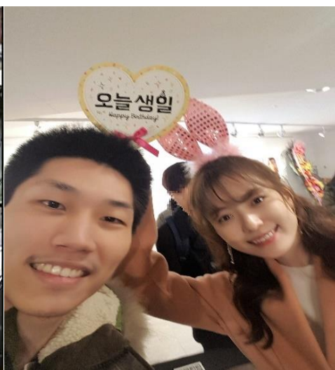
▲與韓國女演員韓孝周的合照