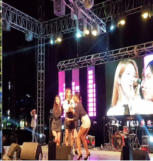
▲首爾科大校慶 - MAMAMOO