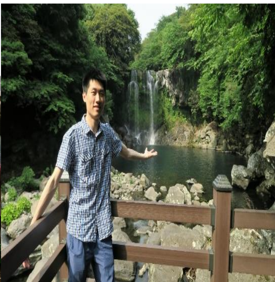
▲濟州島 - 天地淵瀑布