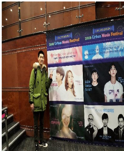
▲韓國獨立歌手안녕하신가영演唱會