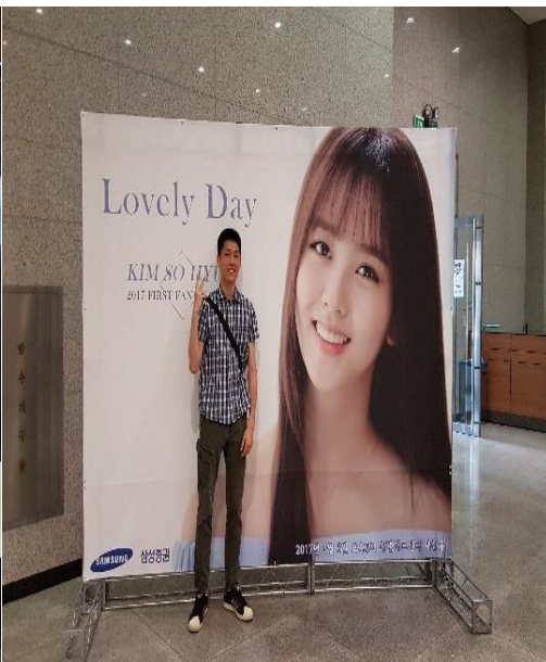
▲韓國女演員金所炫粉絲見面會