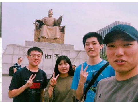
▲光化門世宗大王像