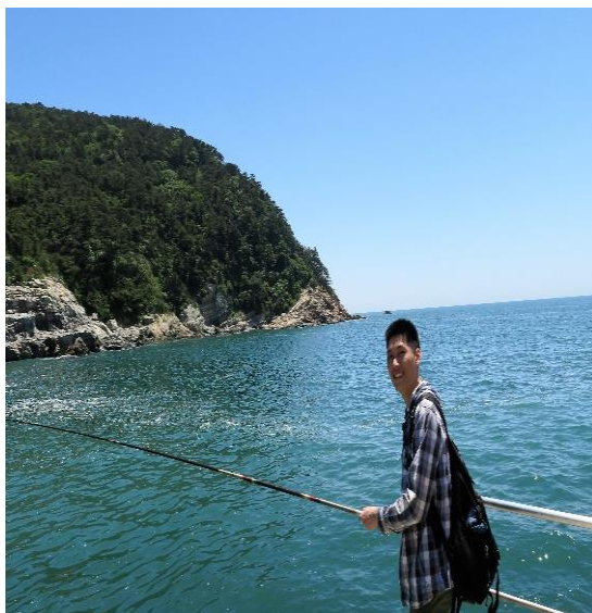
▲釜山太宗臺 - 若原礫石灘