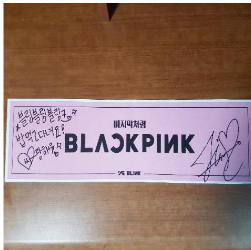
▲BLACKPINK 成員金智秀親筆簽名應援手幅

我參加過蠻多的演唱會、公演、見面會、韓國音樂節目放送(包括事前錄製、事後錄製、生放送)，每次在等待的時候都能結交到新的朋友，這也是我韓文口說迅速進步的原因，至於為什麼會說快速成長呢，在學校遇到的人，通常是在學習而且會基本的英文，但在外面則不是，各式各樣的年齡層，講話用詞也有些許差別，當自己聽不懂或是講話讓人聽不懂，會受到挫折進而更努力的把韓文給學好。特別印象深刻是在七月的BLACKPINK 人氣歌謠事後錄製，當天有個小活動把想要說的話留言在便利貼，再把便利貼貼到板子上，由成員四人親自各選一位贈送簽名應援手幅，我運用累積多年的韓文實力寫下表達自己心意的語句，很幸運的就被選上了，當時的那份喜悅至今都忘不了。