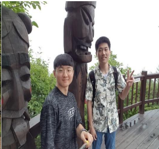
▲大邱八公山與韓國室友