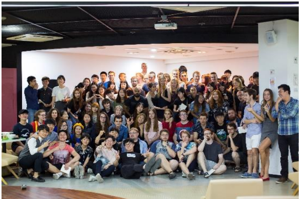
▲ISC 與交換學生的歡送會全體合照

在下學期的時候，在社團博覽會上找到了很有趣的社團名為天狼星(시리우스)，一開始進去的時候很尷尬，當他們知道我是台灣人的時候，先是各種驚訝再來是不敢跟我談話，就算想要聊天也會夾帶著些許的英文，後來相處久了知道我會韓文也開始放寬心來開始跟我講話。這社團很有趣，是觀察星星的社團，有別於其他跳舞唱歌的大眾社團，在社團期間認識了超多有關星座的韓文跟歷史，比起書本上更讓我覺得收穫滿滿，尤其是韓國人社團文化讓我耳目一新，就在剛進去社團的時候都有所謂類似台灣的迎新會，藉由這個聚會來增進社員之間的感情，但跟台灣不同的是，他們會選擇晚上一起吃晚餐，之後就去酒吧喝酒，不是只喝一次，還有第二攤第三攤，甚至喝完再去 KTV 唱到通宵，總之就是大家都醉得不省人事才甘願罷休，我認為這是很快速的讓彼此之間的親近方法，也是韓國特有的文化，我跟著去只能說是嚇傻了，受到的文化衝擊至今還記憶猶新，另外韓國大學社團會在四月初的時候舉辦 MT 活動，