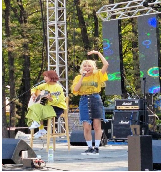
▲首爾科大校慶 - 臉紅思春期