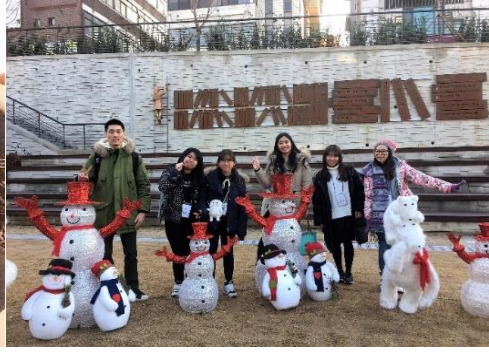
▲麻浦區 City Tour