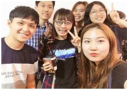
▲ISC 學伴與台灣交換生