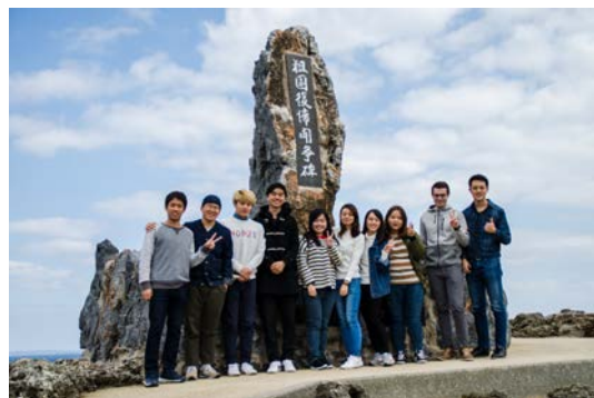
放假與交換生們前往沖繩最北端旅遊