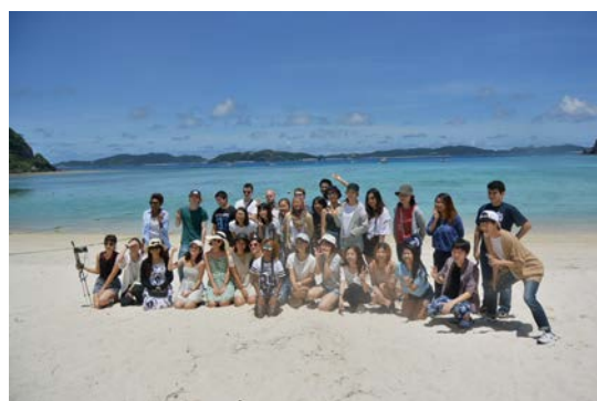
學校小島研習活動兩天一夜