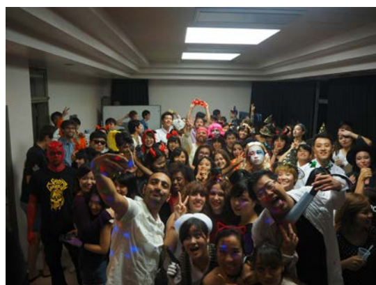
交換生們的萬聖派對