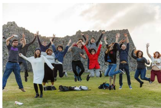
初級班的同學們到中城城跡見學