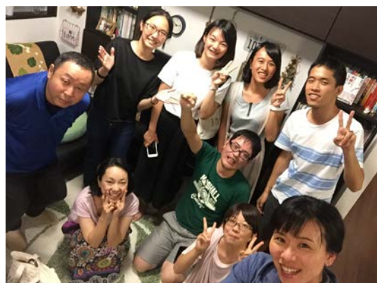
中文補習班的交流會