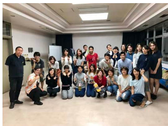
由台灣交換生舉辦的台灣日本交流會