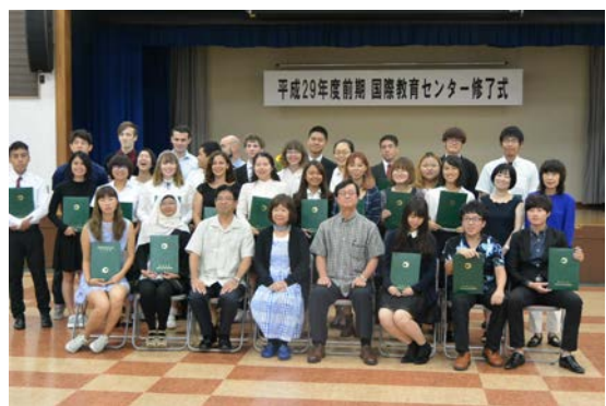
一起在今年八月修業的交換生們