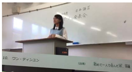
前半年的演講發表