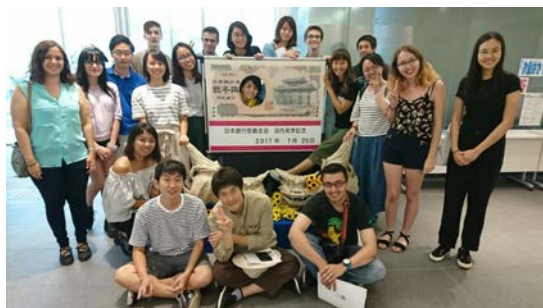
到日本銀行進行見學