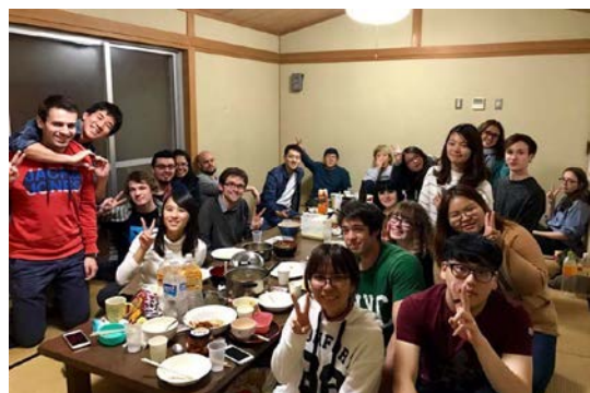
在國際交流會館舉辦聚會