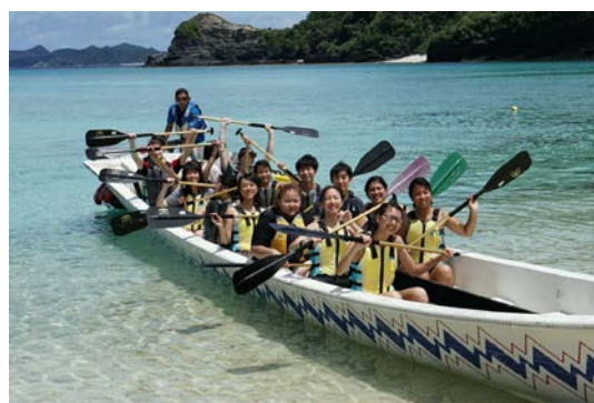
渡嘉敷島體驗划船