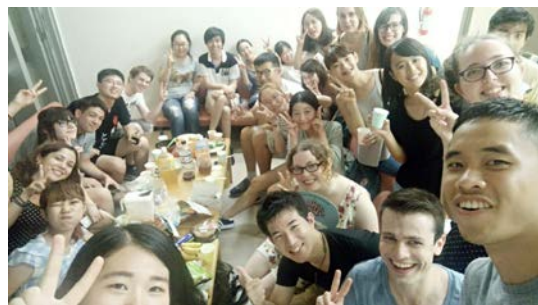
第一次交換生們的聚會