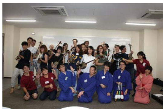
與琉球大學的社團交流