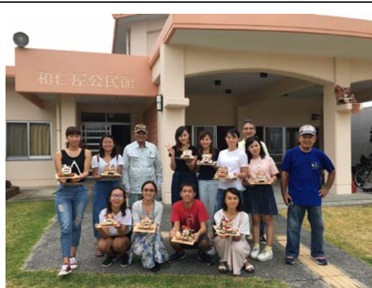
體驗製作シーサー活動