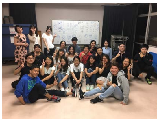
下半年的台日交流會