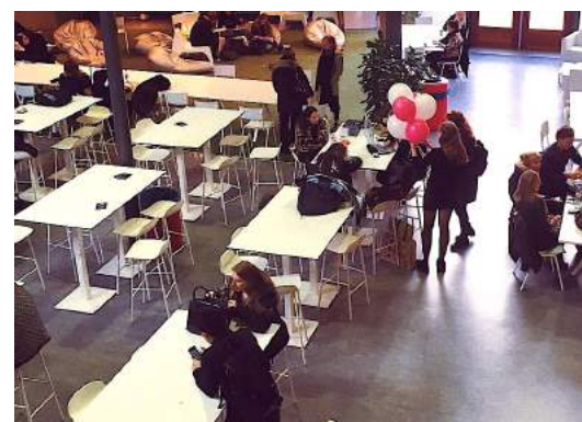
▶ HU 的學生大廳