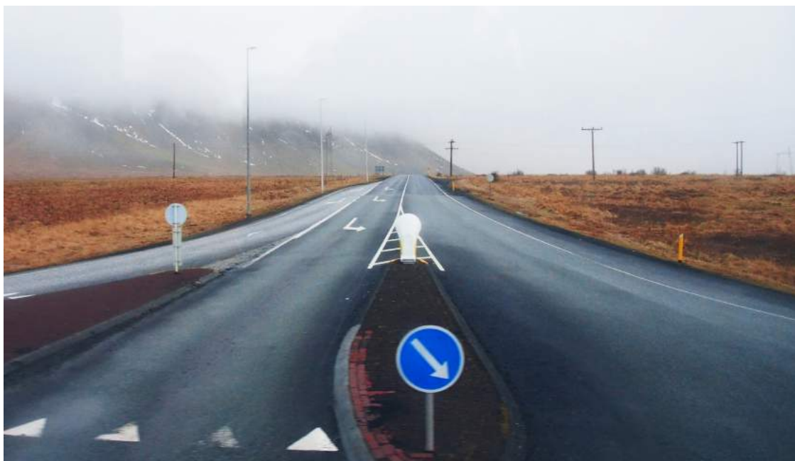
▶ 旅程未完待續 __冰島