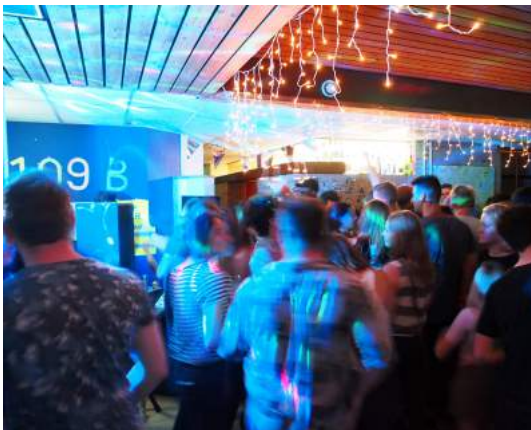
► 離開P宿舍前的最後一場home party

此外，在荷蘭最少不了的就是派對、音樂、啤酒！派對是最快熟識大家的方式：舉辦 home party，或是一起到夜店狂歡；酒酣耳熱盡情享受音樂的當下，總不自覺地拉近彼此的距離。來自歐洲各地的交換生一個比一個會喝，這真是一個“把啤酒當水喝”的國度。看著大家每喝必醉、現場花招百出的盛況，也算是另類的大開眼界。（但同時也不可否認，派對後的現場打掃起來絕對是要人命的！）