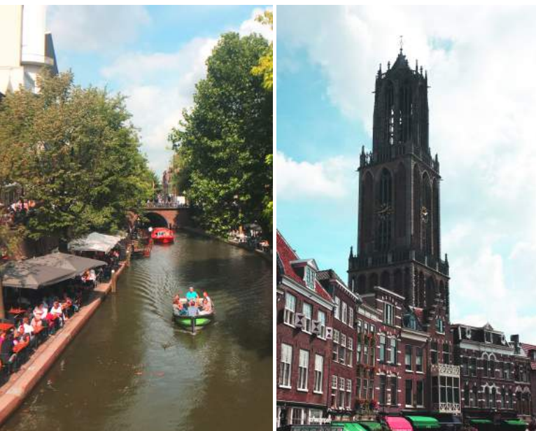
▶ 烏特列支地標Dom Tower與運河

經過這一年，荷蘭愜意的生活感是我最迷戀的部分：自行車文化、豐富的藝文活動、各種主題式市集以及特色小店。坐在運河旁或公園裡即是一處風景，日常就是一場奢侈的視覺饗宴。另外，荷蘭鄰近比利時、英、法、德...等國家，若想在課餘時間遊覽歐洲各地，交通相當方便，是一個很好的旅歐據點！