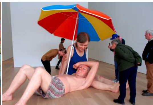
- Museum Voorlinden 沃倫丹現代美術館