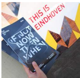
- Dutch Design Week 2016 荷蘭設計週