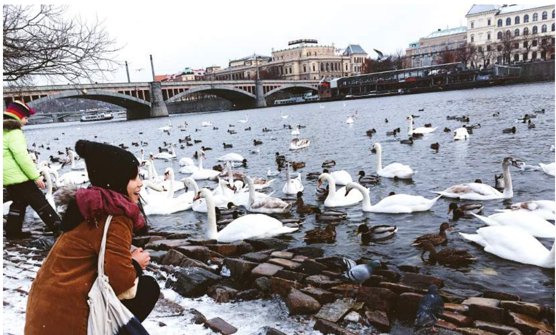
▶ 世界很大，得去看看！親身感受的當下才是真實。_ 布拉格

因為聽多了別人的故事，總對遠方有著無限想像；而眼看升上大四的自己接著即將畢業，於是將累積已久的念頭化為行動：我想當交換學生，出發去看世界！比起留學的昂貴學費，交換學生讓我離夢接近許多；另一方面，希望透過這個機會讓學習多年的英文，在生活與學習上得以實踐。