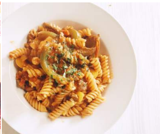
► 日常料理：義大利麵

經典的荷蘭小吃：薯條Friet、生鯊魚Haring、炸魚塊Kibbeling、荷式可樂餅Kroket、楓糖餅Stroopwafel、荷式鬆餅Pannenkoek ... 等；其中荷式鬆餅最令我印象深刻。一開學荷蘭同學就邀請交換生們開鬆餅派對，與大家分享他們從小到大都愛吃的經典荷味。而HU附近就有一間百年鬆餅屋，除了經典的楓糖漿與糖霜調味，還可以添加水果、起司培根等配料，是個享受荷式下午茶的好去處！