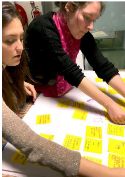
▶ 和組員一起腦力激盪(Brain storming)