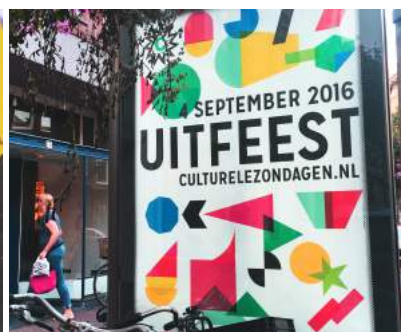
- UITFEEST 烏特列支文化週