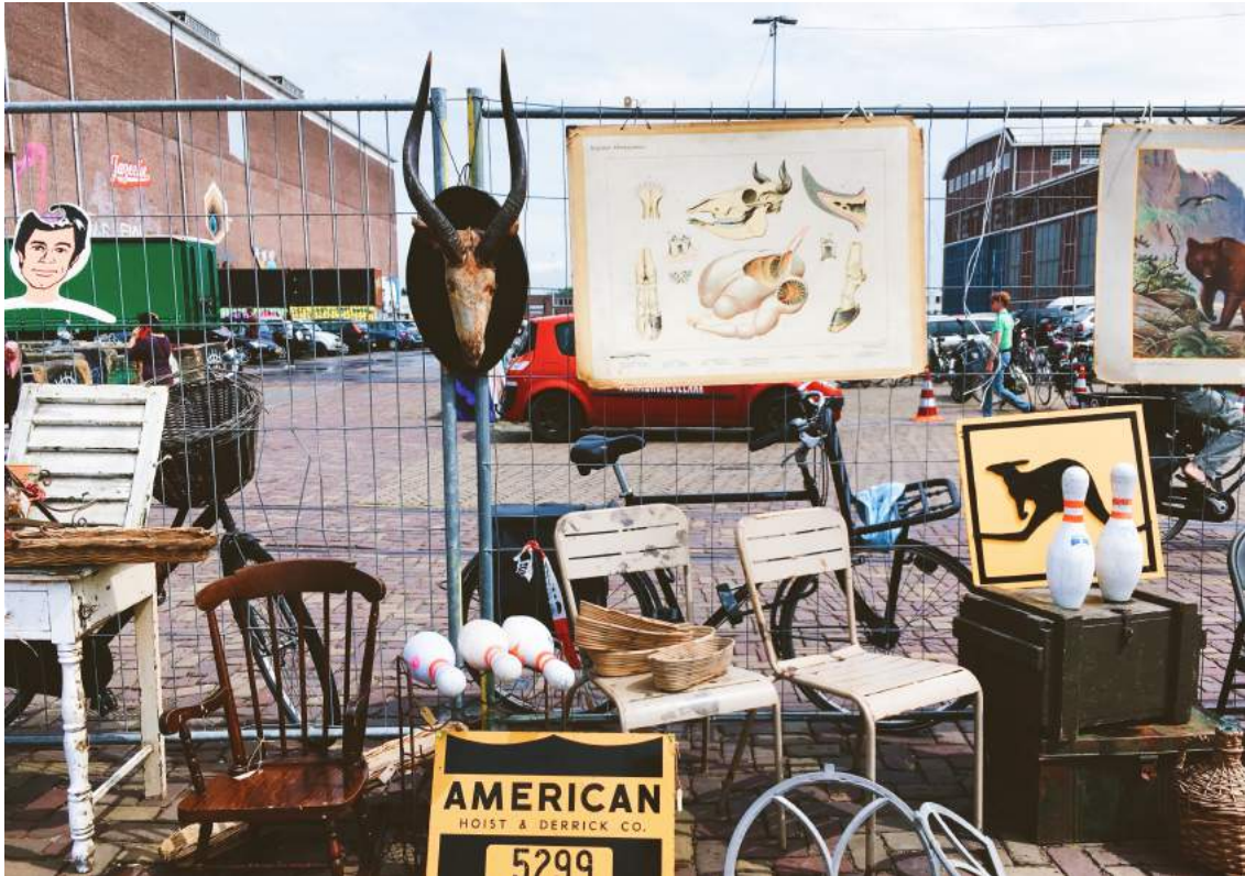
► 位於阿姆斯特丹的跳蚤市集 IJ-Hallen

烏特列支是荷蘭的中心地帶，搭乘火車方便到達各個城市。但我最愛拜訪的還是只隔半小時車程遠的阿姆斯特丹，它就像是一座走不完的遊樂園，每回必有新發現！不論是逛博物館、展覽，還是時常舉辦的主題式市集，都可以讓人度過精彩的一天。雖然有時會被忽晴忽雨的典型荷式天氣搞壞氣氛，卻也讓晴朗的日子更顯得珍貴；在這裡，曬得到陽光的位子總是特別搶手，或暫時把家裡的沙發搬出家門、享受日照也不為過！