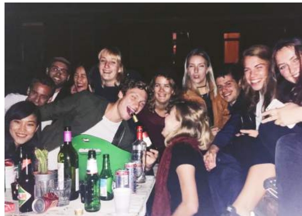
► 在荷蘭同學家的home party