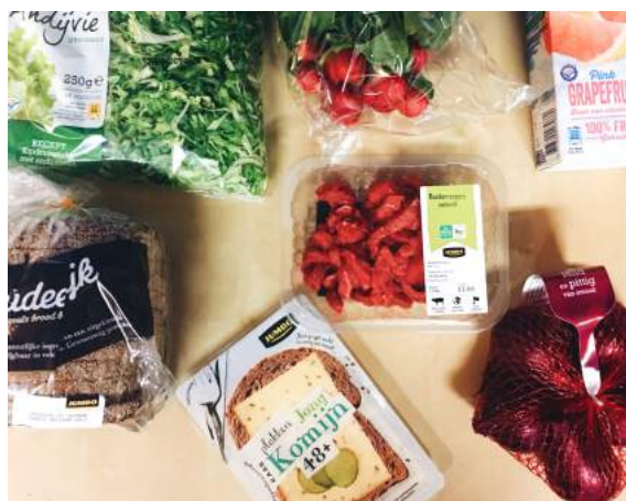
► Jumbo 超市採買