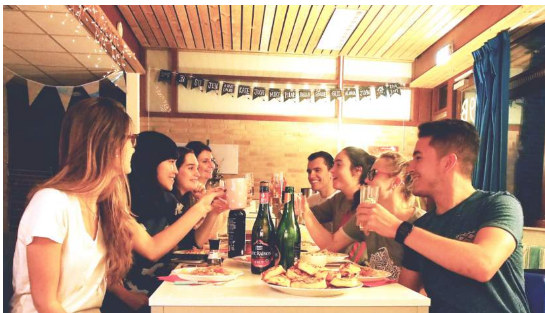
▶ 一人一道料理的感恩節聚餐