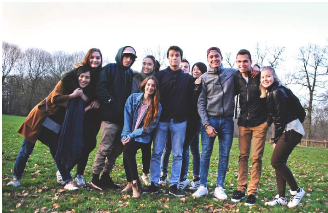
▶ 假日騎車到公園踏青