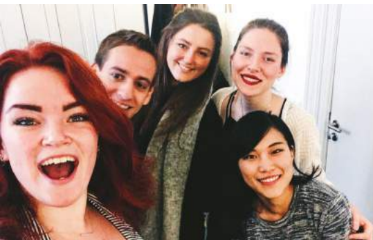
▶ 提報後的組員合影