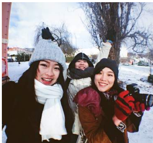
► 和兩位雲科交換生到布拉格旅行

第一次離家半個地球遠，長達一年、看似無憂無慮的歐洲交換生活，其實另一方面時常需要克服種種挑戰：語言和文化的隔閡、學業上的挫折、自助旅行時的不安、偶然的思鄉情緒...等等疑難雜症，在這一年內不斷交錯出現；雖然當下心情總是五味雜陳，但回頭去看的時候才會發現，多虧有這些不平順，才能讓我的交換生活過得如此深刻！