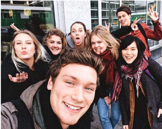
▶ 期末提報結束後與荷蘭同學合影留念