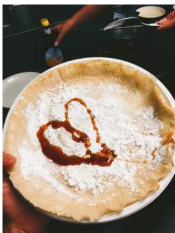
► 荷蘭同學的自製鬆餅

經典的荷蘭小吃：薯條Friet、生鯊魚Haring、炸魚塊Kibbeling、荷式可樂餅Kroket、楓糖餅Stroopwafel、荷式鬆餅Pannenkoek ... 等；其中荷式鬆餅最令我印象深刻。一開學荷蘭同學就邀請交換生們開鬆餅派對，與大家分享他們從小到大都愛吃的經典荷味。而HU附近就有一間百年鬆餅屋，除了經典的楓糖漿與糖霜調味，還可以添加水果、起司培根等配料，是個享受荷式下午茶的好去處！