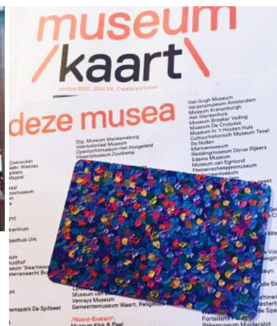
- Museum Kaart 荷蘭博物館卡 (可免費、享折扣參觀超過400家荷蘭的博物館)