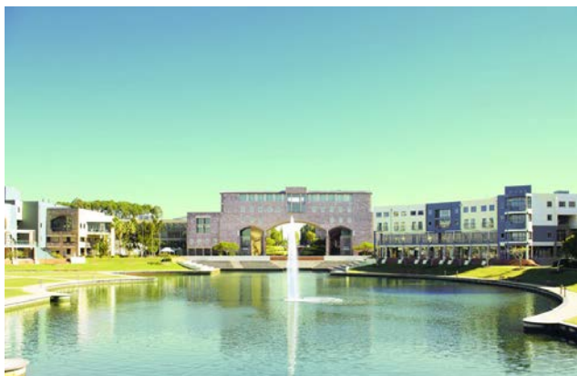
圖 2 (邦德大學校區)

此課程是針對從未學習過西班牙文所設計的，除學習西班牙語外，學生將接受各方面的指導並發展必要的技能，使他們能夠應付一系列的日常情況。本課程旨在提供最大程度的西班牙語言和文化，讓學生可以體驗西班牙文化中多樣性的風化。