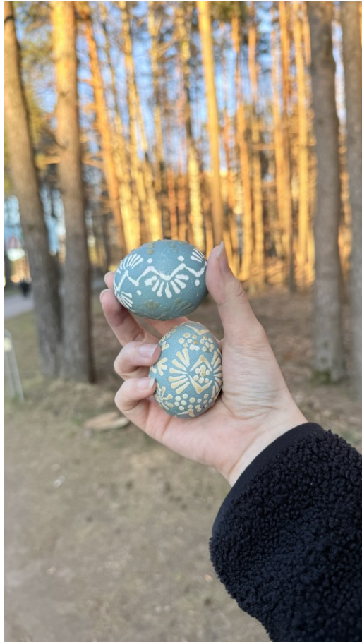
體驗蠟染復活節彩蛋