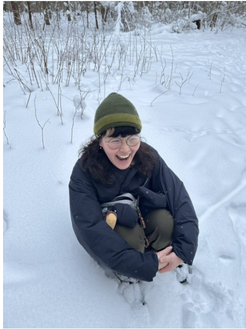
二月初與宿舍同學一起在森林健行