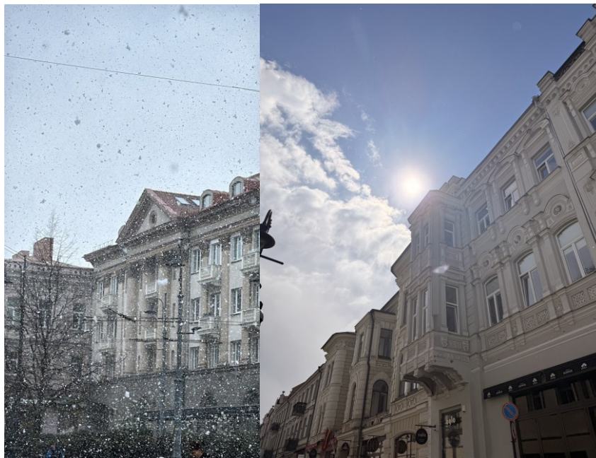
四月底的變化無常古怪天氣的一天