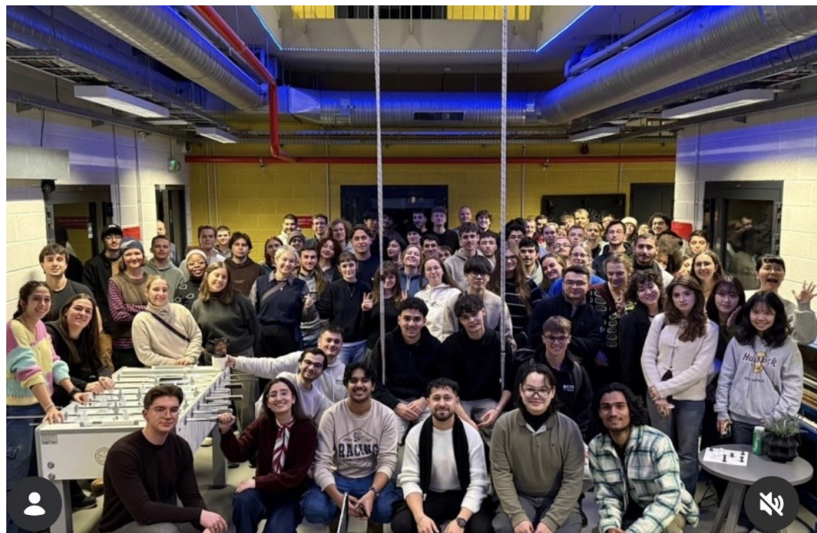
新生週的桌遊活動

在交換期間，ESN 社團每個月也會籌辦不同的活動，讓交換生能夠體驗當地文化或認識更多朋友。由於很多活動都會有免費的茶點飲料，因此經常與朋友一起去參加。同時也體驗了人生中的第一次派對與其他不同的夜生活。在立陶宛的 ESN 也會聯合舉辦一些活動，讓不同學校間也能夠交流認識，包含芬蘭旅遊、情人節派對、體育競賽等等。