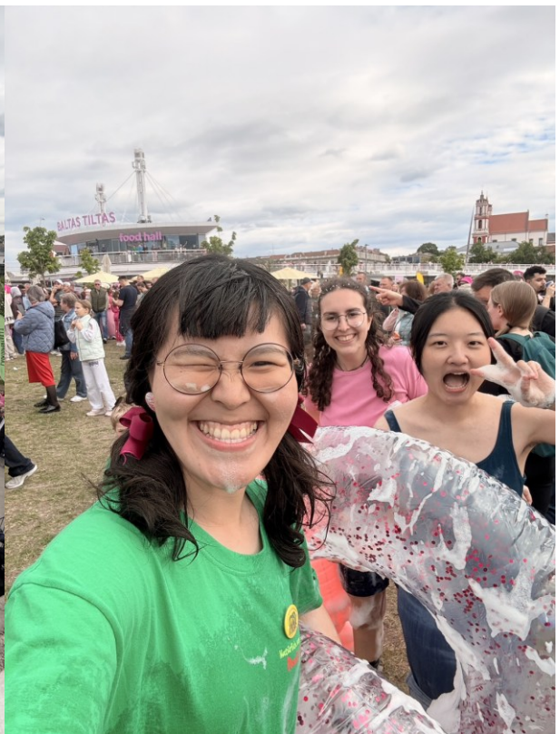
2/11 立陶宛獨立日的篝火儀式、5/29-31 立陶宛粉紅湯節活動