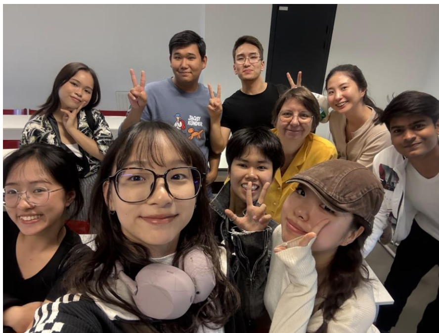
▲同學與可愛的法文老師