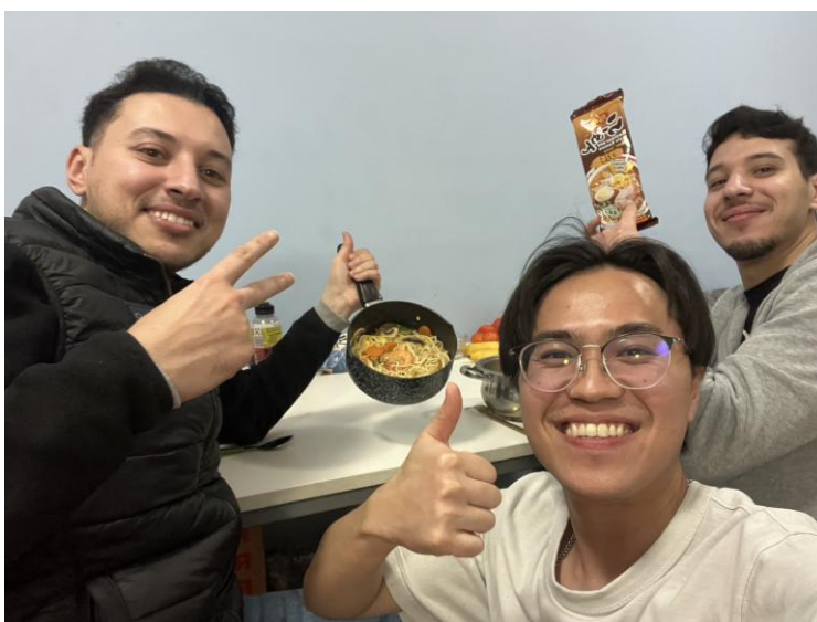
註：與室友一起煮拉麵