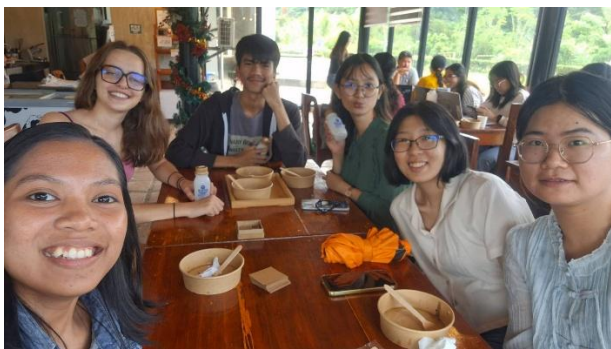
跟菲律賓朋友和其他交換生一起 吃飯玩桌遊