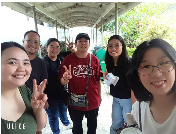
我的碩士班同學們，他們總是很照顧我，在課業上也給我很多的幫助