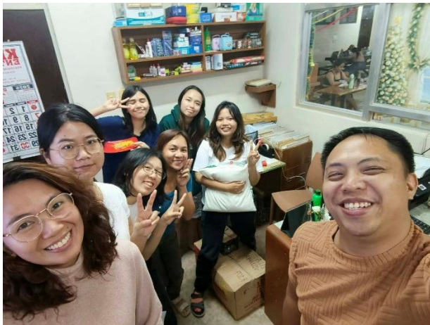
與宿舍經理和同學們的合照