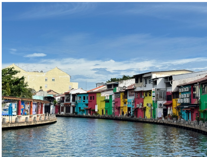
馬六甲城市街景紀錄

當地不少建築保有獨特的風格，如南洋風格等。房屋色彩繽紛多彩蛋也不會感到紊亂，在太陽的光線輔助下形成一種特有的美感。