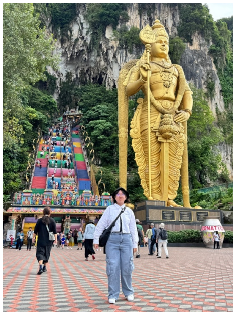
黑風洞印度神像參訪合影

參訪的過程中，看見了許多宏偉且壯麗的自然景觀與歷史遺跡，其中有不少景觀是自然與人類文化共存。透過當地人的解說以及各個文物旁邊的文字說明，讓我對馬來西亞的當地人文特色、歷史有更深入的了解。