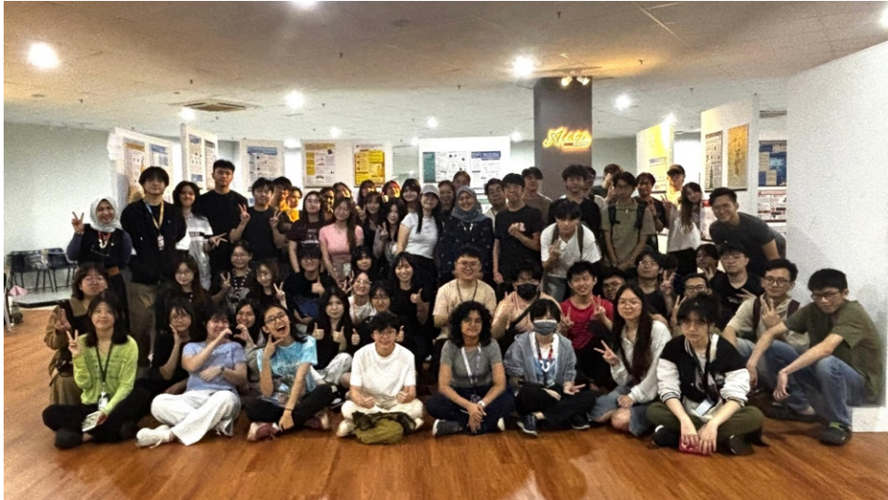
Design Research 課堂全體師生合照