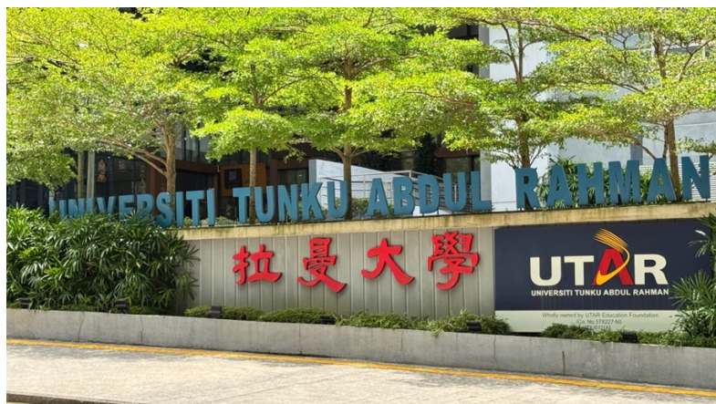
拉曼大學 Sungai Long 校區 KA 大樓入口旁標誌

學校設有多個學院與學程，如醫學與健康科學、創意產業、工程、建築、會計與管理等等。除特定專業會使用中文授課以外，大多數的課程皆以全英文授課。