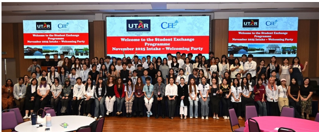
交換生迎新餐會合照

除了學習以外，拉曼大學的國際事務處還有安排多個活動讓交換生們相見歡、互相認識彼此、促進交換生們交流。在這次餐會中認識了許多來自不同國家的交換生們以及學伴們，也互相分享了彼此的家鄉文化。