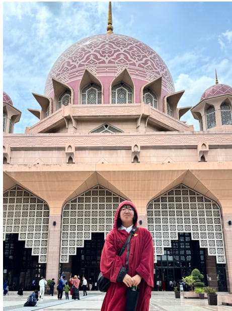
粉紅清真寺參訪合影

當地不少建築保有獨特的風格，如南洋風格等。房屋色彩繽紛多彩蛋也不會感到紊亂，在太陽的光線輔助下形成一種特有的美感。