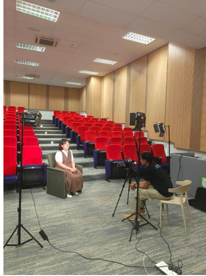
參與交換生心得分享錄製

在課外時間，四處參訪了馬來西亞的當地文化與周遭自然與人文環境，走訪了巴生 Klang、布城 Putrajaya、吉隆坡 Kuala Lumpur、馬六甲 Malacca、怡保 Ipoh、檳城 Penang、雲頂高原 Genting highland、芙蓉 Seremban 等地。也因為大眾交通相當方便，尤其是跨州參訪的部分可以選擇搭乘火車、國內航班或長途巴士等方式前往，對於學生來說相當方便也很省錢。