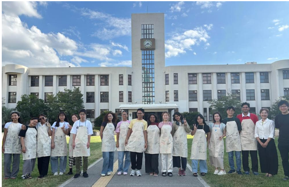
圖 交換生與導師們

此次赴日研修最大的收穫在於語言能力的提升與國際視野的拓展。起初雖能理解他人談話內容，但因擔心表達錯誤而不敢開口。在同學與師長耐心鼓勵與指導下，逐漸建立自信，日常生活中已能不依賴翻譯軟體進行基本溝通，也能以簡單日語與店員對話，為未來持續學習日文打下良好基礎。此外，透過與來自世界各地的同學互動，也讓我更加理解不同文化背景下的思維方式，拓展了自身的國際觀。