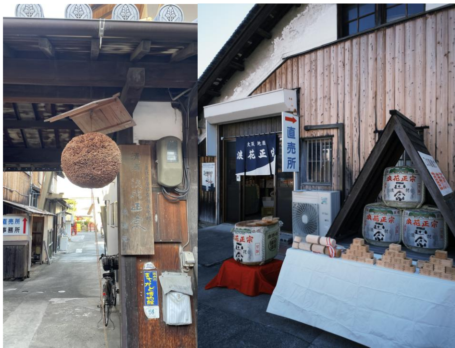
圖 浪花酒造新酒活動

社會創新訓練：FR-A 是一門實務的課程，學生依照產業別分組進行學習。我所屬的單位位於大阪尾崎的浪花酒造有限會社，主要協助清酒廠進行品牌轉型相關工作，如設計傳單、剪輯影片等。期間也實際參訪清酒釀造過程，並首次品嚐不同風味的清酒，更參與新酒活動協助接待賓客，讓我學習到了日本傳統產業如何結合創新行銷。