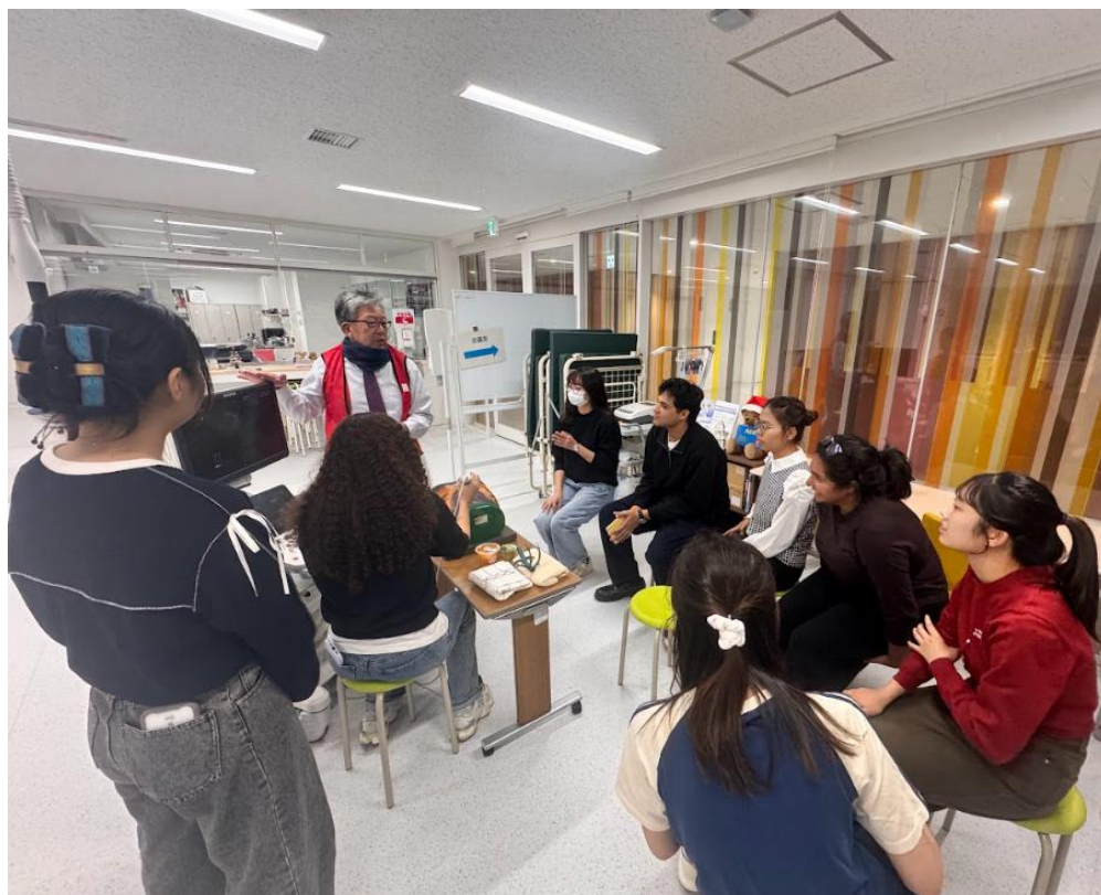
圖 大阪公立大學護理系

國際合作工作（ICW）則為醫學院相關課程，導師安排了醫院實地參訪活動，並讓學生實際體驗使用超音波、聽診器等醫療設備，使課程不僅停留在理論層面，而是結合實地參訪。透過這門課，我首次進入 ICU 參觀，並親眼看到手術室的即時影像，對醫療體系有了更具體的認識。