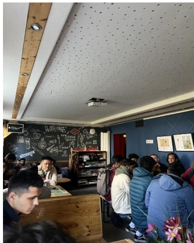
圖二、參與校內交換生 We4You 活動

交換期間，我逐漸突破了對使用英文及德語的恐懼。以前在台灣，總擔心語法錯誤或口音問題，常讓我在交流時不夠自信。然而，在德國的課堂與生活中，我發現語言的核心是溝通，而非完美的表達。即使外語能力有限，只要適度調整說法或搭配肢體語言，依然能順利交流。在這樣的練習中，我慢慢放下對錯誤的擔憂，能更自然地參與討論並主動表達想法。語言不再是我的障礙，而成為我認識世界與拓展視野的重要橋樑。