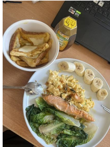
圖六、自己練習下廚

由於沒有選修德語課程，我主要透過 Duolingo 以及日常生活的互動來練習語言。和其他國際學生一起使用 APP，讓學習像在玩遊戲，邊練習邊交流。日常生活中，我會觀察和模仿德國人的習慣：結帳時的會話、交通工具票券的使用、暖氣與自助結帳機操作、健康保險流程，以及德鐵常有的月台臨時變動和時間管理。這些細節都成了我自然練習德語的機會，也幫助我更快適應當地生活。