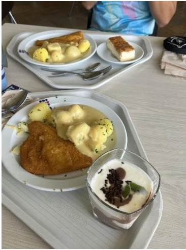
圖五、學校 Mensa 餐廳

在德國的飲食對我來說算是多變化的挑戰。學校的 Mensa 提供的餐點選擇還算多，但有時候我會覺得不太符合自己的口味，因此我也常自己下廚，烹調一些熟悉的亞洲料理。自己煮飯不僅經濟實惠，也能吃到更多自己喜歡的食物，而柏林的亞洲超市提供各式各樣的台灣、日本、韓國及泰國食材，讓我即使身處異地，也能重現家鄉味。這種自己安排餐點的經驗，讓我學會更好地規劃生活，也享受到烹飪的樂趣。