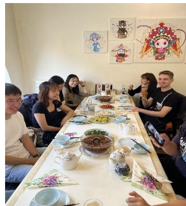
圖四、與交換生在餐廳吃飯