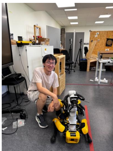
比賽照片(原本的機器人)