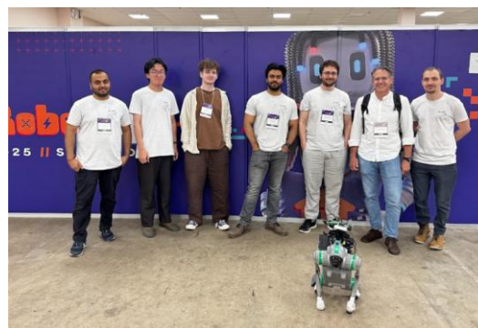
比賽照片(因海關電池限制更換的機器人)