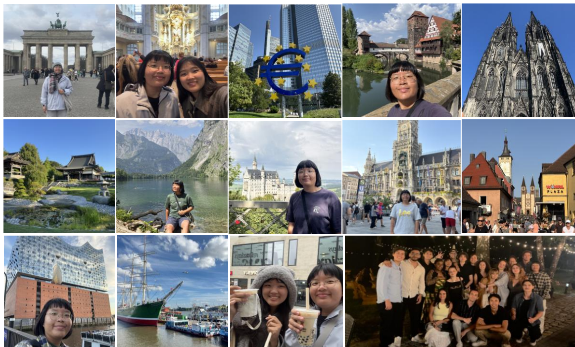
德國境內旅遊與回憶

這段交換生活對我而言，不僅僅是學術上的收穫，更像是一場自我成長的洗禮。回顧這六個月的點滴，我深深感受到，每一次跨越困難、適應環境的過程，都讓我累積了珍貴的回憶與經驗。這段旅程已成為我人生中難以取代的重要一頁，也讓我在面對未來未知挑戰時，更加勇敢與從容。