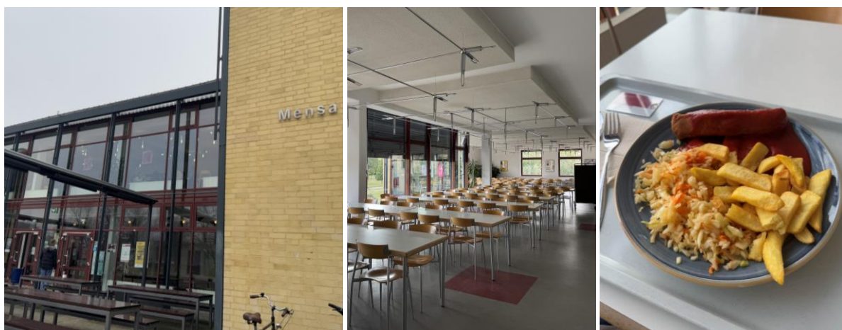
左:學生餐廳外觀 中:學餐內部 右:學餐(2~4 歐不等)

食：我在交換期間基本上每天都是自己煮飯，外食的次數不多，學餐也是偶爾才會吃(經濟實惠，學餐一份 2~4 歐不等)。如果是自己下廚的話花費不大，德國超市物價蠻親民的，有些商品價格甚至比台灣便宜，而距離學校最近的超市走路大約十分鐘就會到了，非常方便！裡面的東西可說是應有盡有，因此我非常喜歡逛超市，每週都會逛 1~2 次！另外，建議可以下載德國超市 App，裡面會有線上傳單可看本周促銷且也有優惠券可以使用，藥妝店 DM 及 Rossmann App 也會提供折價券。若要購買亞洲食材，亞洲超市在柏林市中心，基本上想得到的亞洲食材在亞超都買的到。