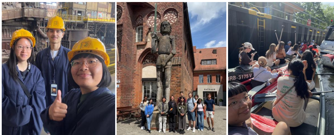
左:參觀工業博物館 中:布蘭登堡城市漫遊 右:滑獨木舟

課程內容：以實地參訪的方式，帶學生認識布蘭登堡市及德國歷史相關的文化景點。老師會用英文介紹各個景點的歷史及故事。這學期參訪了：布蘭登堡考古博物館、布蘭登堡大教堂和大教堂博物館、舊鋼鐵廠的工業博物館，以及參訪柏林的國會大廈，下學期（春季交換）還會有滑獨木舟的戶外活動，以不同角度體驗城市文化。另外，上課時間是在週六的中午集合，會有特定的日期，老師會用 E-mail 通知學生上課時間；而且沒期末考試和報告，以出缺席來決定期末分數。 感想：這是一門非常值得推薦的課程，不僅能夠深入了解布蘭登堡的城市歷史與文化背景，還能透過參訪不同的博物館與地標，拓展對德國社會與歷史的理解。同時，因為老師全程以英文授課，對於提升聽力與專業英語能力也有很大幫助。透過課程活動，能更貼近在地文化與歷史脈絡，讓交換經驗更加豐富而有意義。