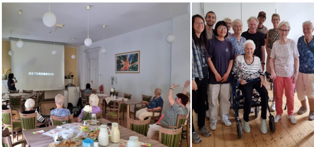
養老院的一日活動

感想：這是一門能帶來豐富收穫的課程。除了課堂上透過簡報內容的教學，老師還安排許多校外學習活動，讓我們能更貼近地了解德國社會與文化。例如：老師帶我們到學校附近的住宅居，觀察不同形式的住宅設計，並思考其中反映出的文化與社會差異；也帶我們去柏林參觀「柏林的地下世界」展覽，了解當時東西柏林的歷史背景與人們的生活處境；這學期的重點活動是到養老院籌辦一日活動，透過與長者的交流互動，讓我們更真切地體會德國社會價值觀與人際關係的面貌。這些經驗都讓我對德國文化有更深刻的理解與反思，課程也非常有趣、很有意義。