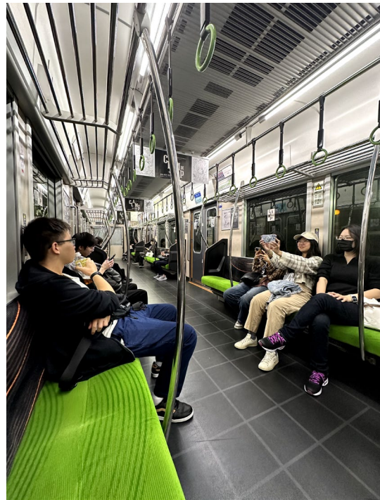
跟著一起來交換的朋友跨年聚餐和出去玩