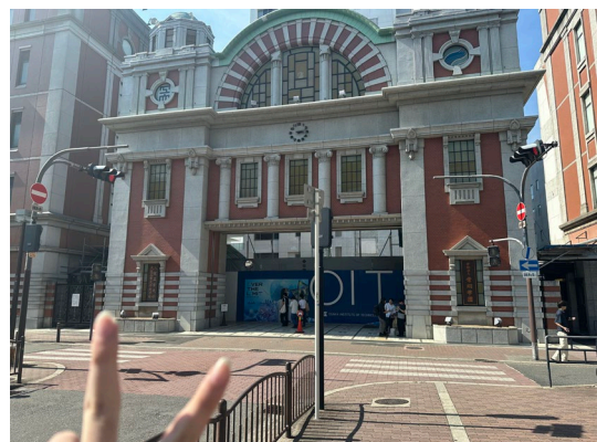
大阪工業大學正門口