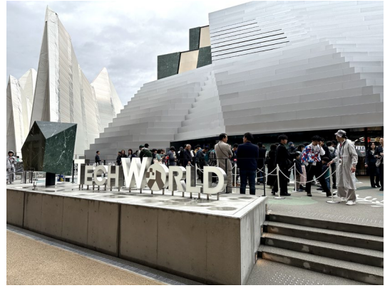
剛好遇到日本舉行的世界博覽會，開幕日當天也有去參觀台灣館，榮是介紹台灣的半導體產業。