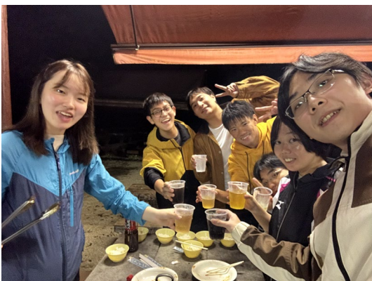
和研究室的朋友一起出去露營